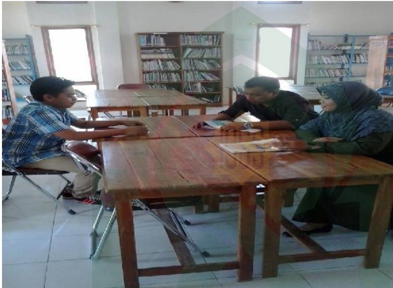
Gambar wawancara dengan pemustaka