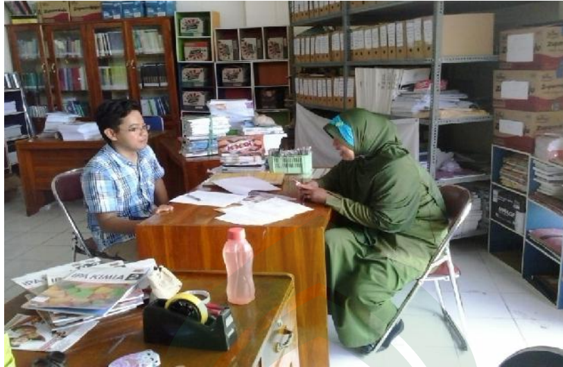
Gambar wawancara dengan ibu Yammarnas