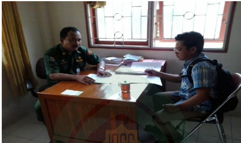
Gambar wawancara dengan kepala perpustakaan

informasi yang mereka butuhkan”. (Anshar, Barru tanggal 21 November 2014)