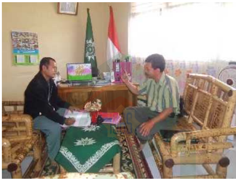
Wawancara peneliti bersama Kepala MTs Muhammadiyah Tolitoli