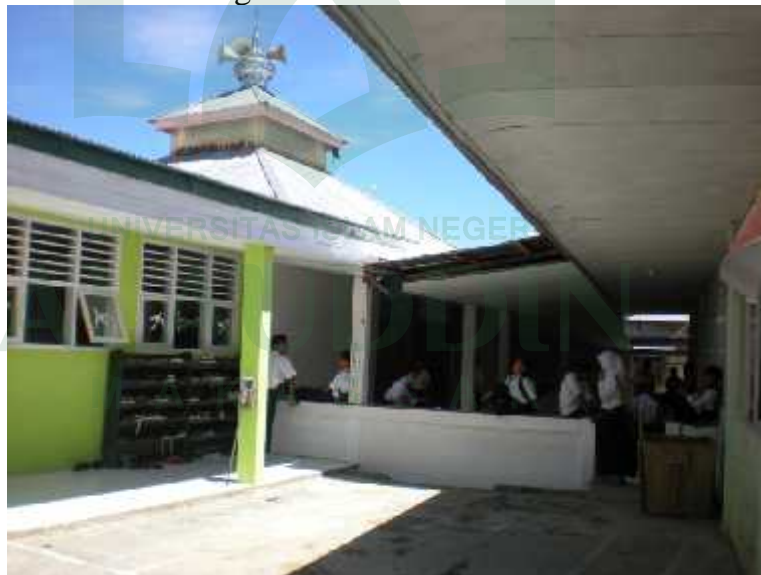
Halama dan Musollah SMP Nurul Ihsan Kabupaten Tolitoli Tgl. 29 Juli 2011