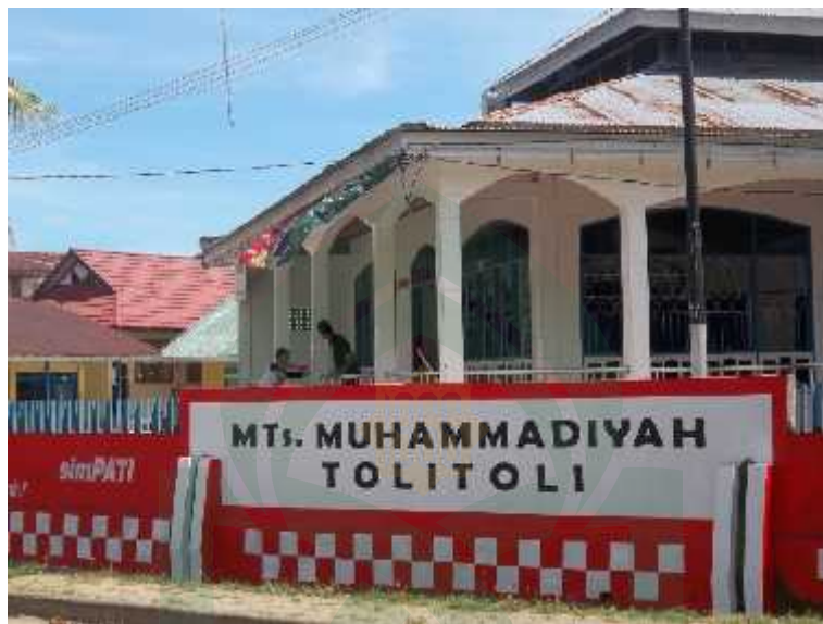
Tampak depan MTs Muhammadiyah Tolitoli Kecamatan Baolan