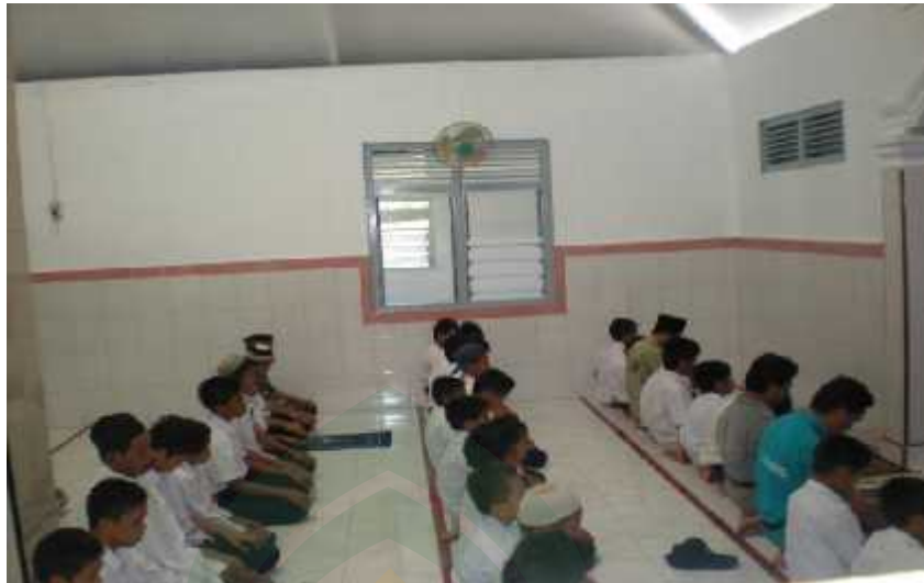
Sholat Duhur Berjamaah Siswa dengan Guru di Musollah SMP Nurul Ihsan Kabupaten Tolitoli Tgl. 29 Juli 2011