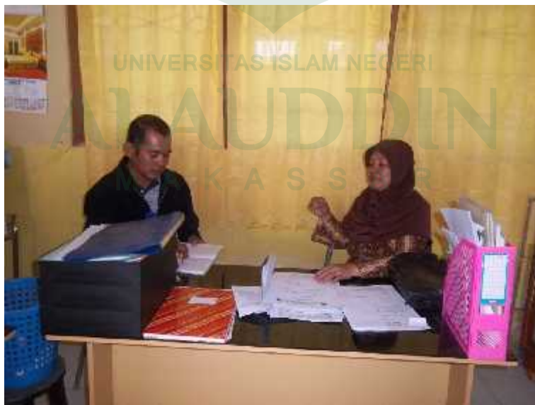
Wawancara peneliti bersama Wakil Kepala MTs Muhammadiyah Tolitoli