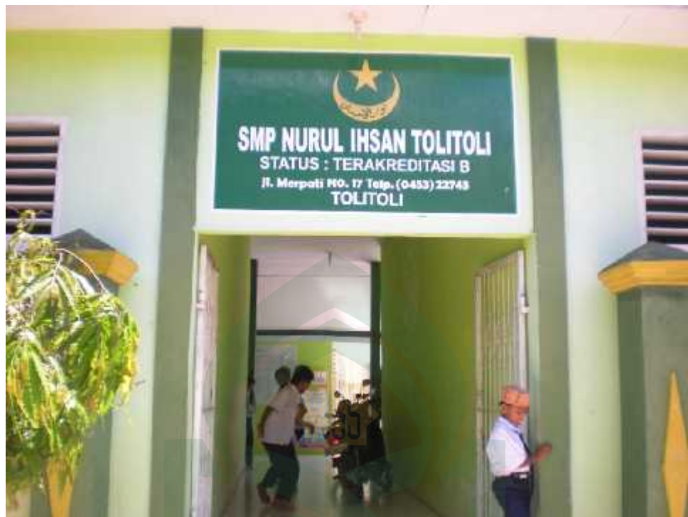
Pintu Gerbang SMP Nurul Ihsan Kabupaten Tolitoli, Tgl. 20 Juli 2011