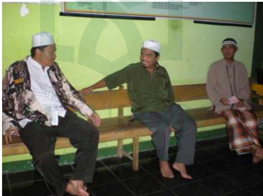
Wawancara dengan Pengurus Panti Asuhan Nurul Ihsan, Tgl. 23 Juli 2011