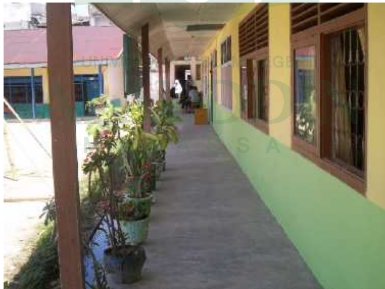
Tampak depan ruang kelas MTs Muhammadiyah Tolitoli Kecamatan Baolan