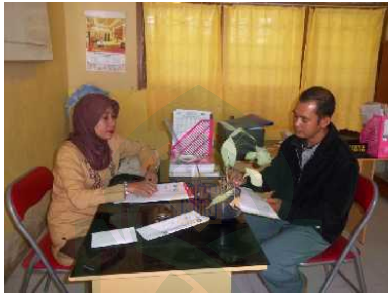
Wawancara peneliti bersama salah satu guru di MTs Muhammadiyah Tolitoli