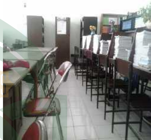
a. Ruang Baca