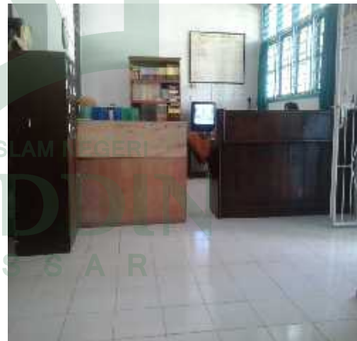
d. Meja Sirkulasi