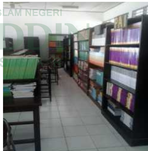
b. Koleksi Non Fiksi