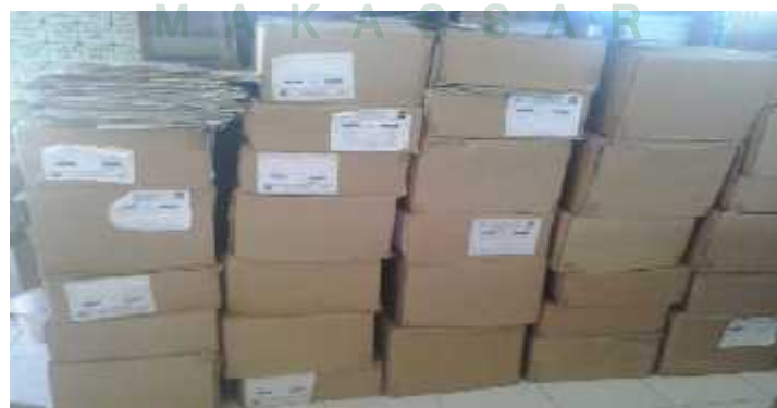
f. Koleksi Buku Kurikulum 2013