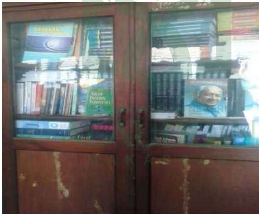
j. Koleksi Biografi