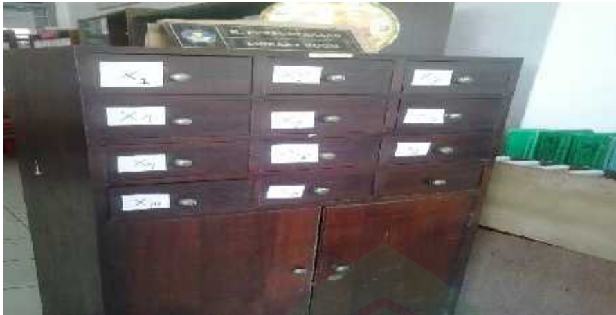
i. Lemari Katalog Manual