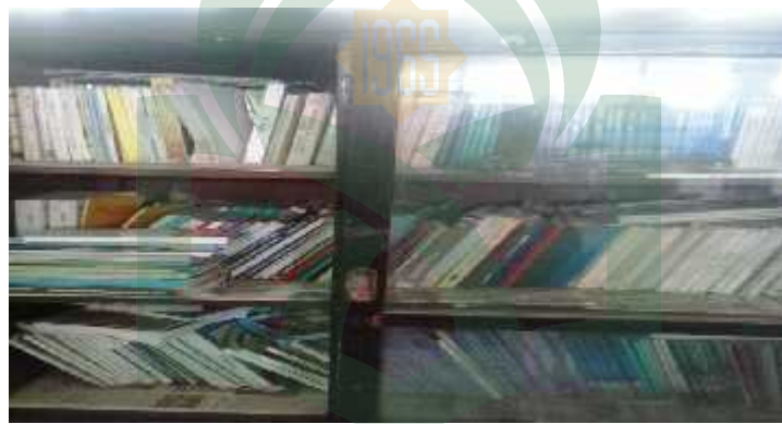
g. Koleksi Fiksi