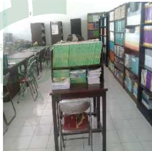
k. Kondisi ruangan Perpustakaan SMAN 10 Makassar