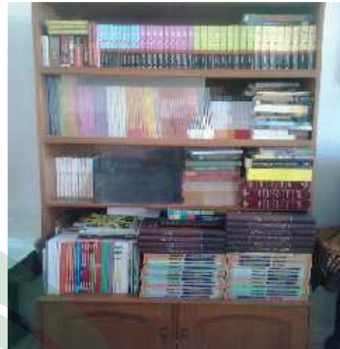
e. Koleksi Referensi