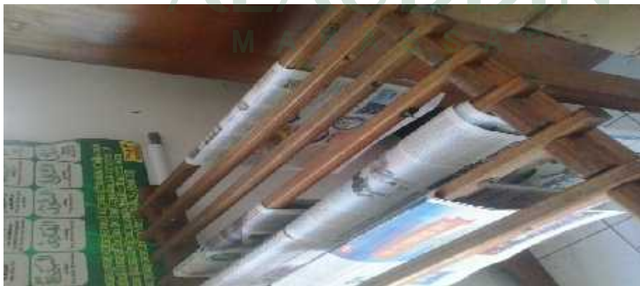
h. Rak Surat Kabar