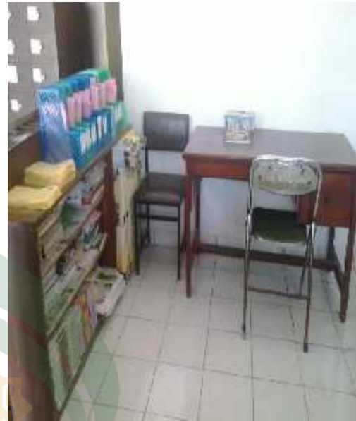
c. Meja Kerja