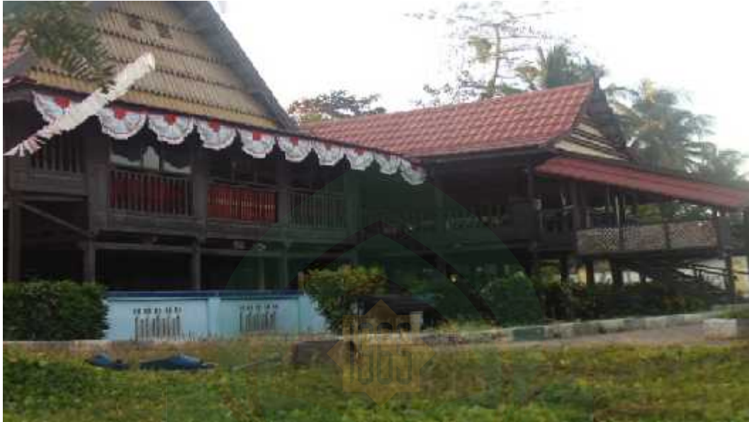
Balla Lompoa Galesong Selatan Kabupaten Takalar