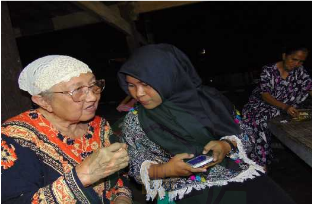
Wawancara bersama Dg.caya