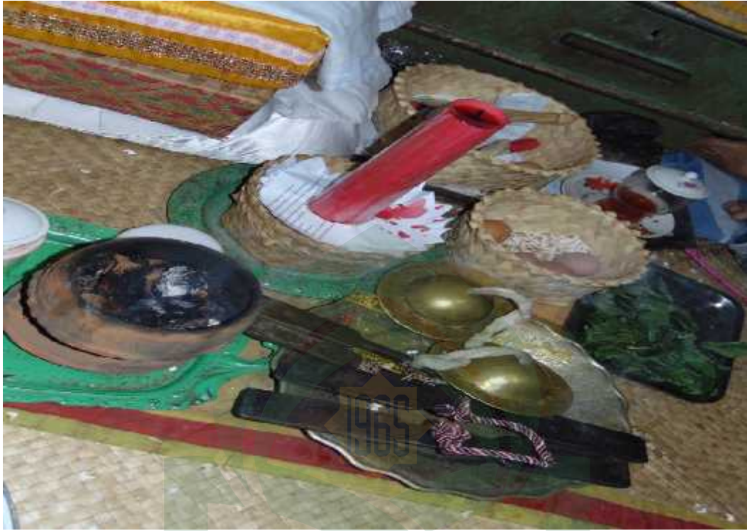
Salah satu syarat untuk memulai Acara