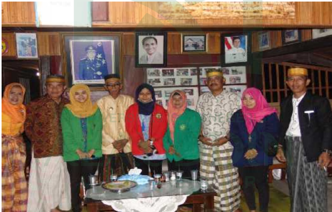
Keluarga Karaeng dan Mahasiswa Peneliti UNHAS