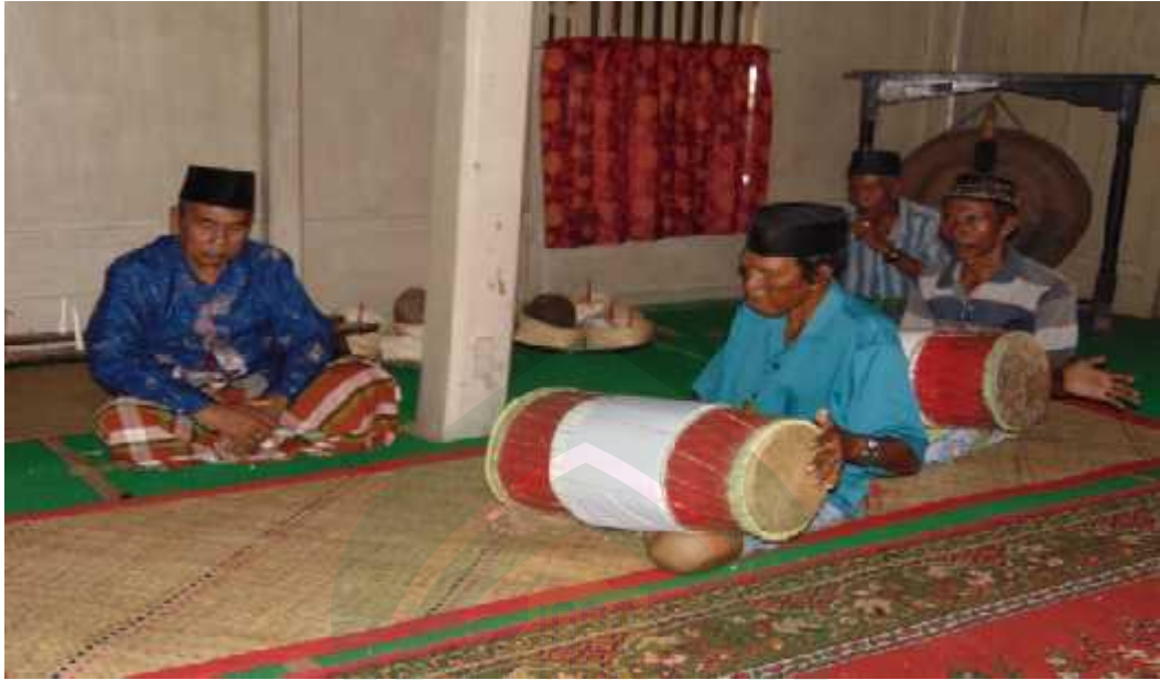
Suara Gendang dan pui'-pui' sebelum dimulainya acara