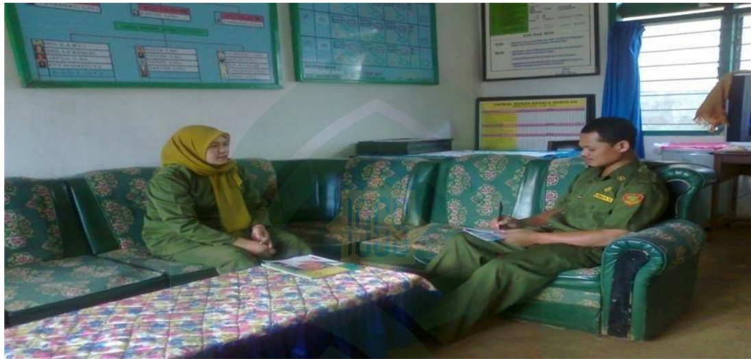
Foto wawancara dengan guru mata pelajaran Al-Qur'an Hadis