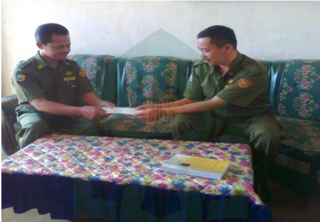
Foto Penyerahan Surat izin Penelitian kepada Kepala MTs Darus Shafaa Manipi (16 April 2012)