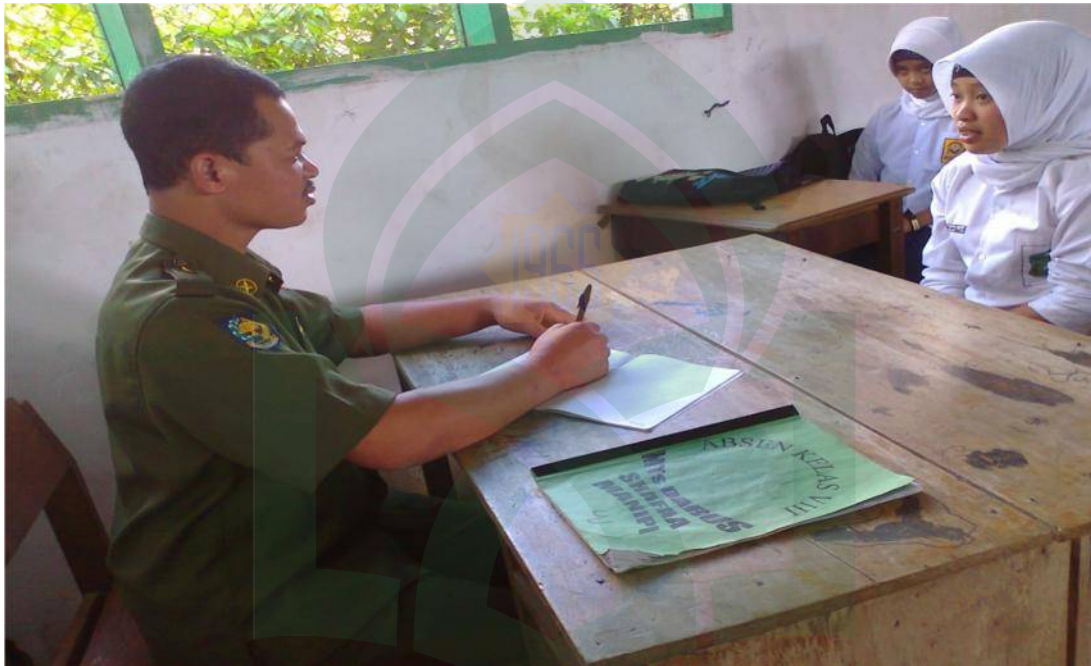
Foto sewaktu wawancara dengan siswa kelas VIII yang mengalami kesulitan belajar