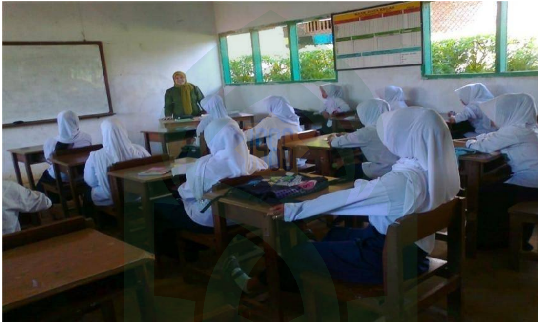
Foto kelas VIII sedang menerima materi pelajaran al-Qur'an hadis