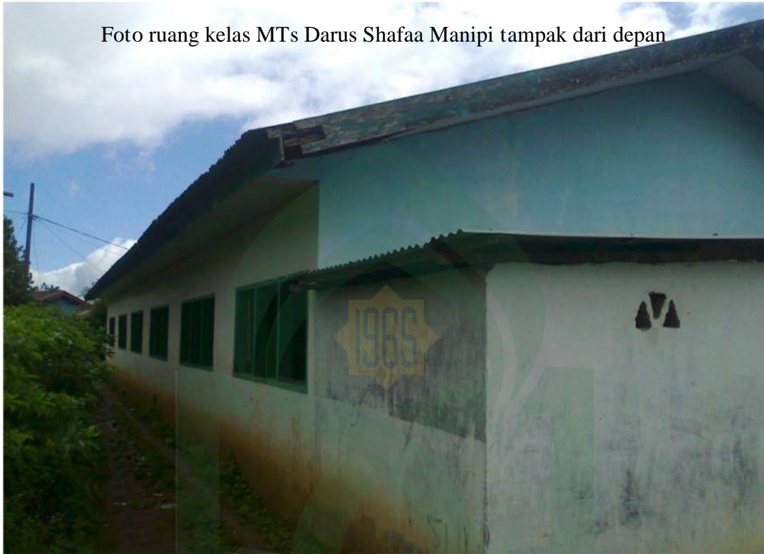
Foto gedung MTs Darus Shafaa Manipi tampak dari samping belakang