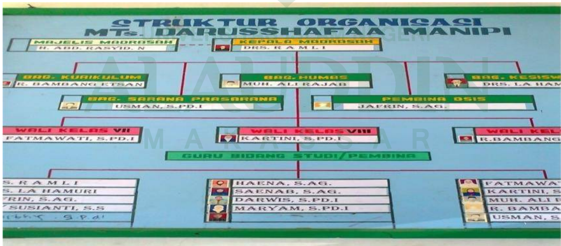
Foto Struktur Organisasi MTs DarusShafaaManipi