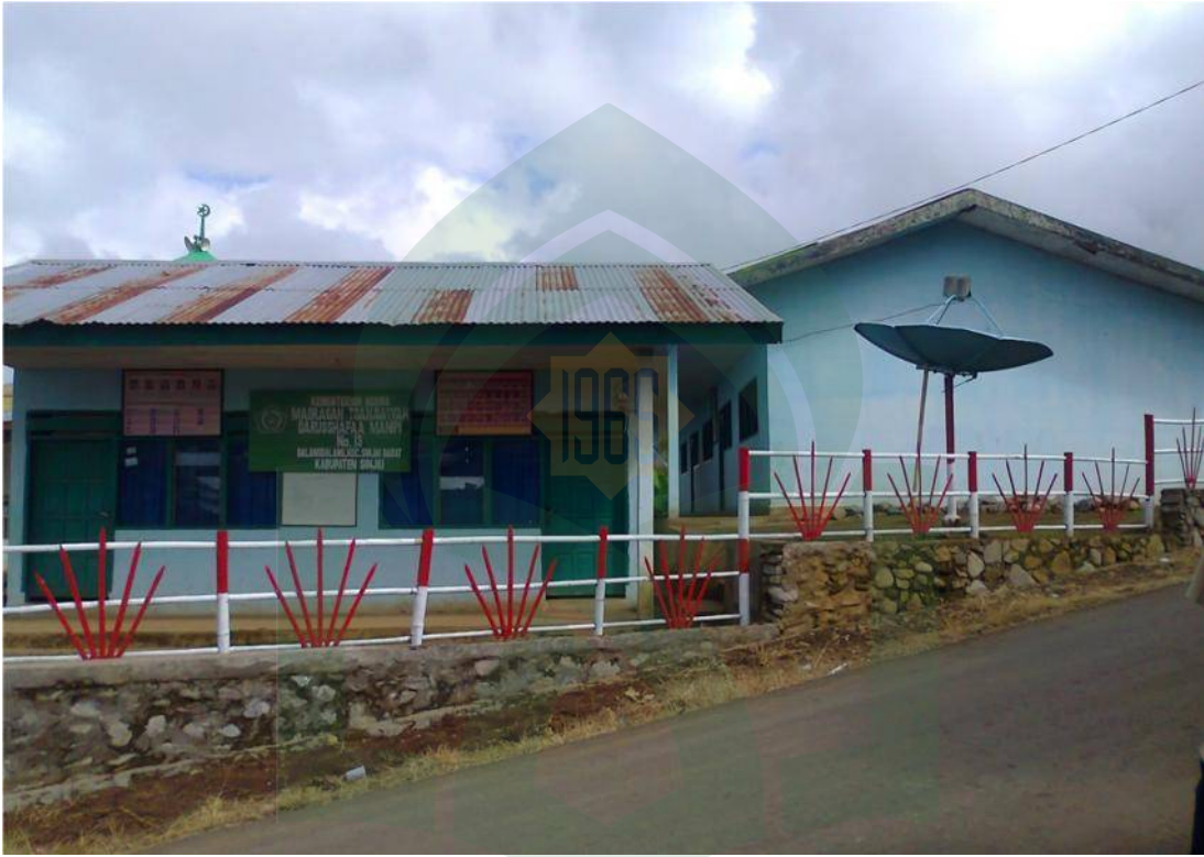
Foto MTs Darus Shafaa Manipi Tampak dari depan