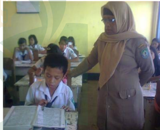
Proses Pembelajaran Guru PAI SMP Negeri I Poleang Kabupaten Bombana