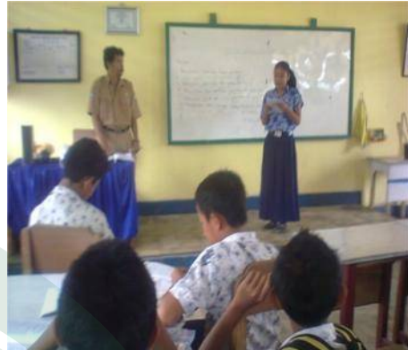
Proses Pembelajaran Peserta Didik SMP Negeri I Poleang Kabupaten