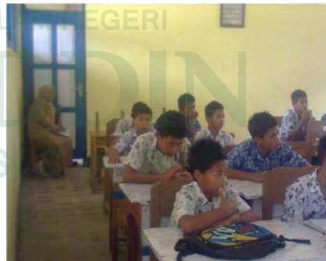
Proses Pembelajaran Guru PAI SMP Negeri I Poleang Kabupaten Bombana