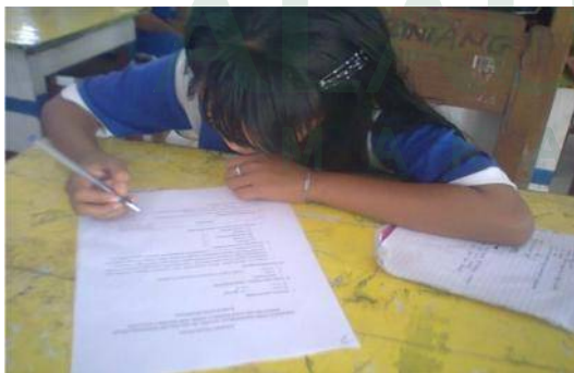
Peserta Didik sedang mengisi angket