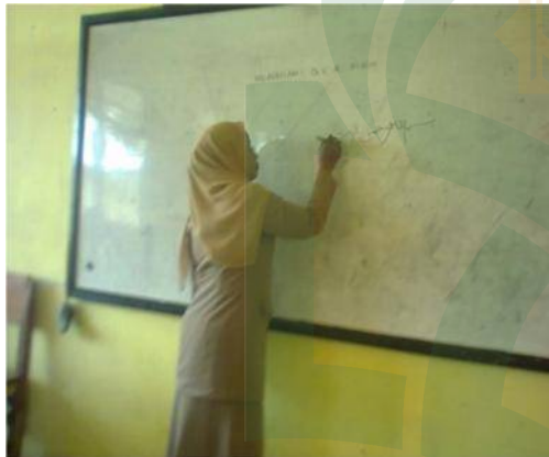
Proses Pembelajaran Guru PAI SMP Negeri I Poleang Kabupaten Bombana