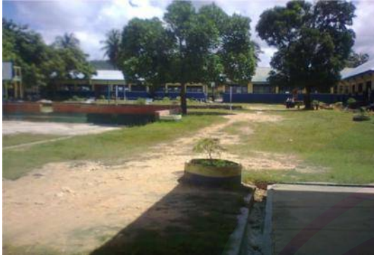
Sekolah SMP Negeri 1 Poleang