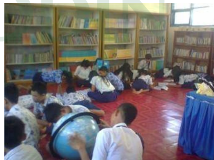
Peserta didik sedang belajar di perpustakaan