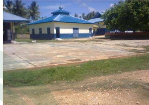
Musalla Sekolah SMP Negeri 1 Poleang