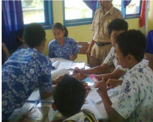
Proses Pembelajaran Peserta Didik SMP Negeri I Poleang Kabupaten