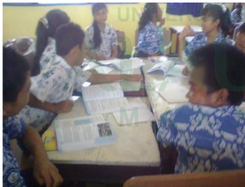
Proses Pembelajaran Guru PAI SMP Negeri I Poleang Kabupaten Bombana