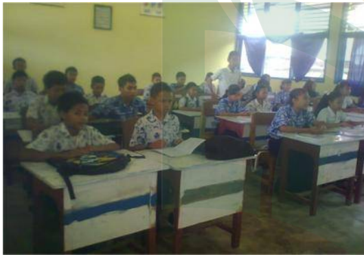
Proses Pembelajaran Peserta Didik SMP Negeri I Poleang Kabupaten Bombana