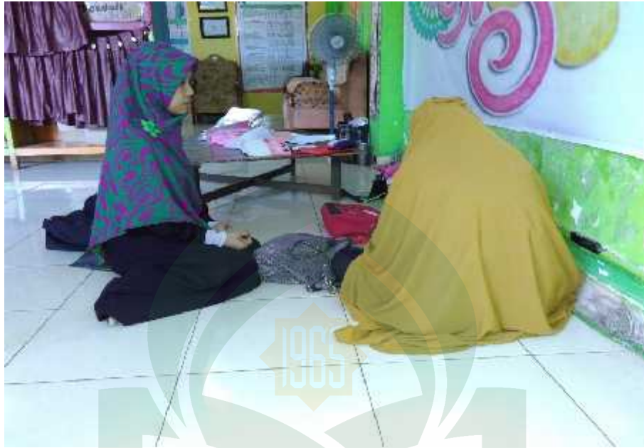
Gambar 1. Harniaty Latief (37 tahun) Pengurus Departemen Paud.