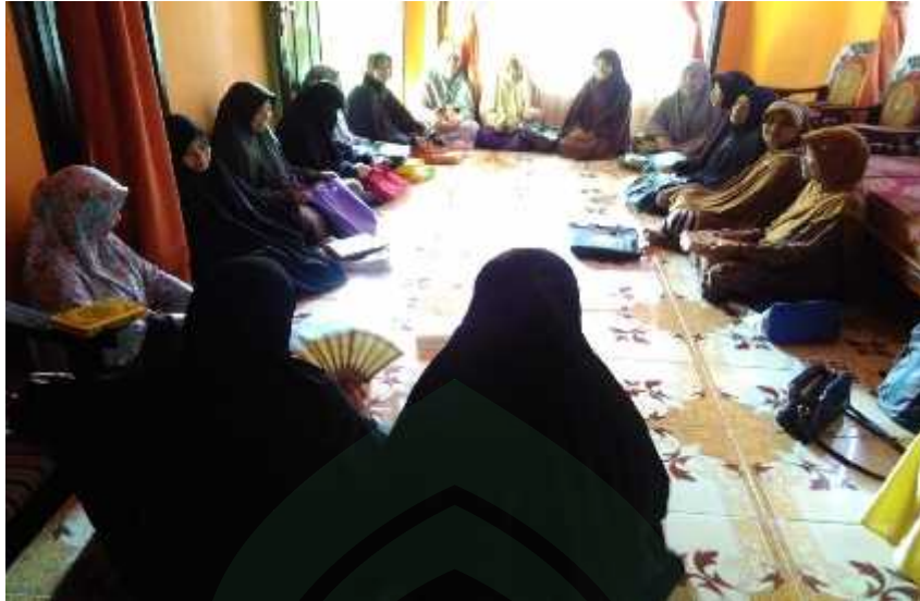
Gambar 3. Pengajian bulanan Muslimah Wahdah Islamiyah