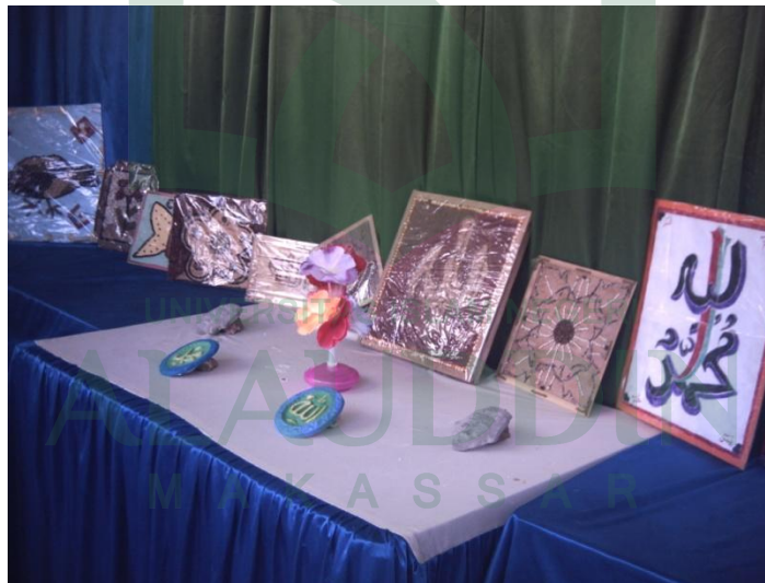
Hasil Karya siswa ekstrakurikuler Seni