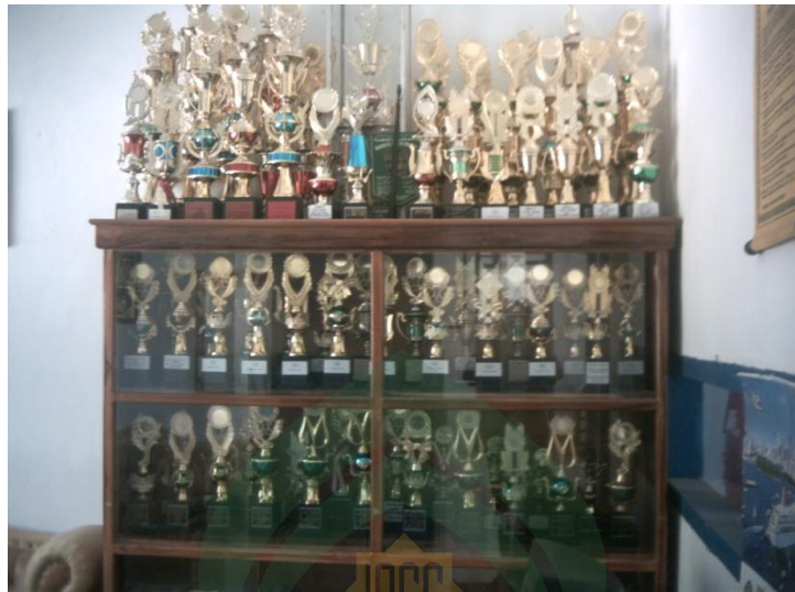
Piala Penghargaan yang Sebagian dari Kegiatan Ekstrakurikuler