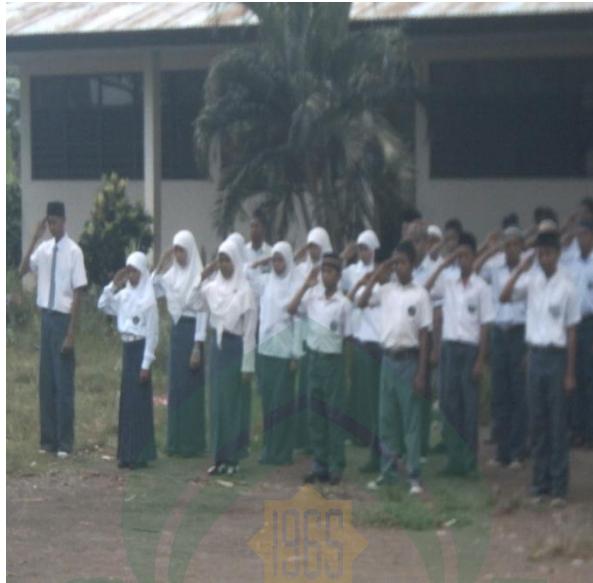
Upacara Bendera Hari Senin