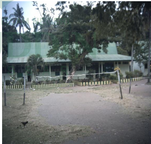
Sekolah Tampak dari Dalam