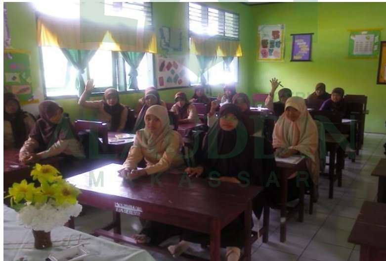
Keaktifan Siswa di Kelas