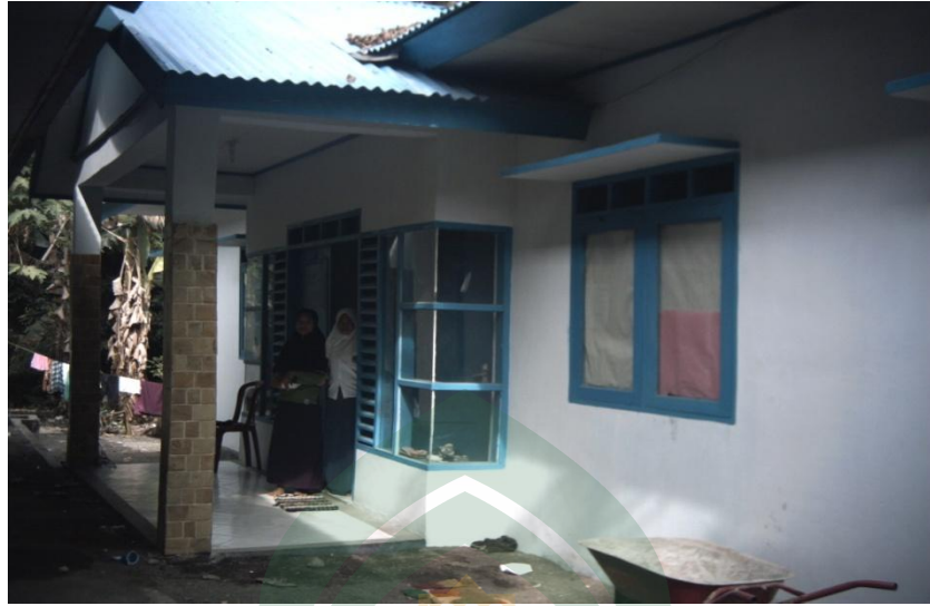
Asrama untuk Ekstrakurikuler Kegamaan