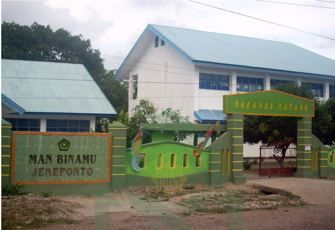
Sekolah Tampak Depan