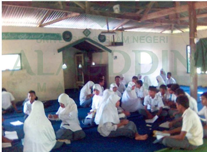
Aktivitas Ekstrakurikuler Keagamaan