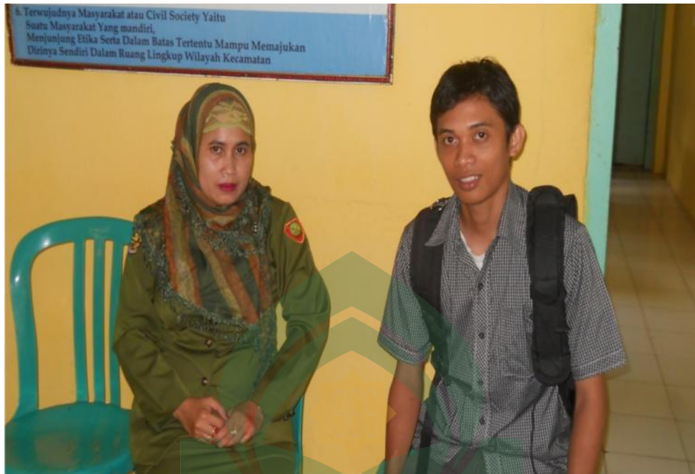
Gambar 3. Foto bersama Kepala Desa Waji Kec. Tellu Siattinge