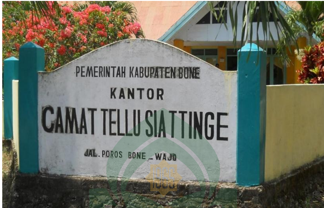
Gambar 1. Tugu Kantor Kec. Tellu Siattinge