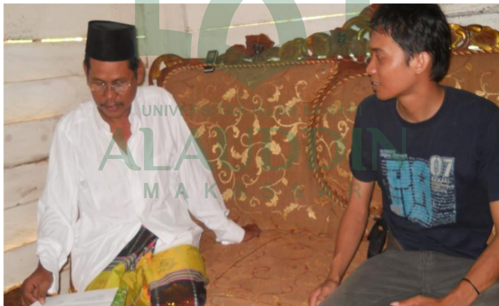
Gambar 4. Foto bersama Kepala Desa Patangnga Kec. Tellu Siattinge