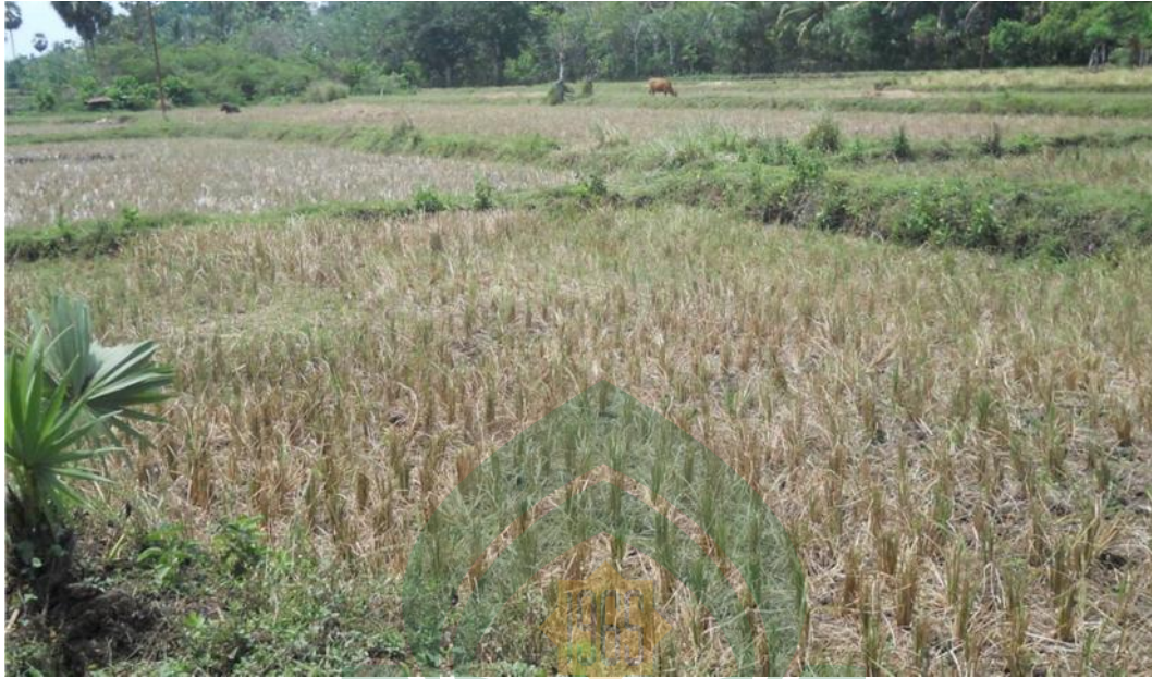
Gambar 9. Tanah Wakaf di Desa Waji