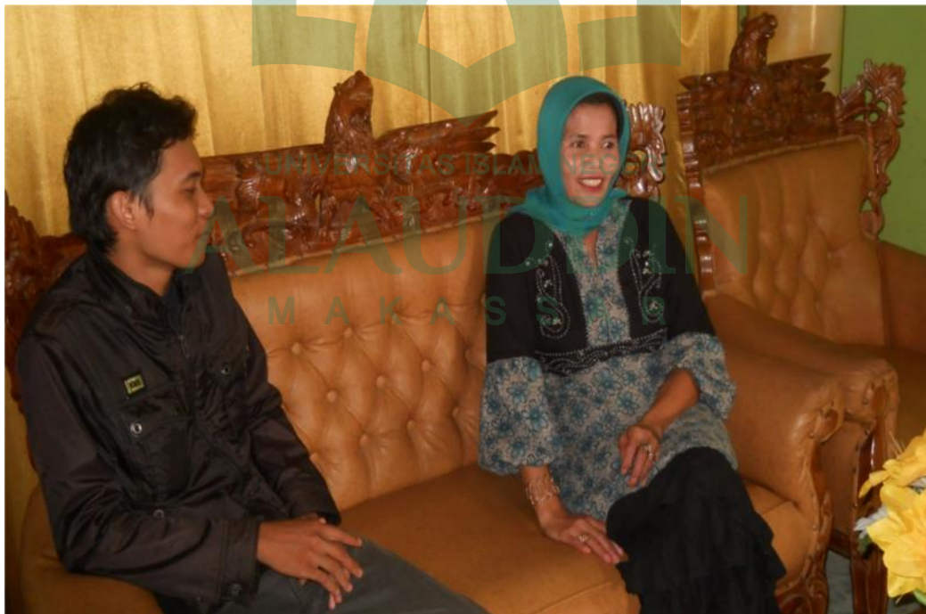
Gambar 6. Foto bersama Kepala Desa Lappae Kec. Tellu Siattinge