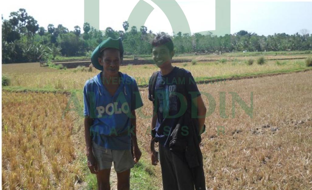
Gambar 8. Foto bersama Imam Desa Patangnga Kec. Tellu Siattinge di Lokasi Tanah Wakaf