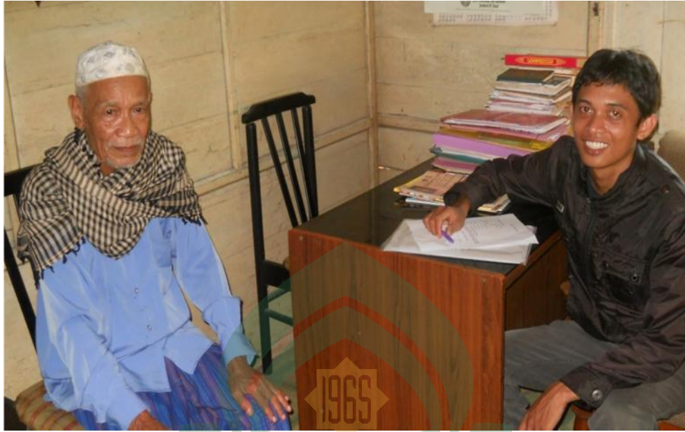
Gambar 7. Foto bersama Imam Desa Waji Kec. Tellu Siattinge