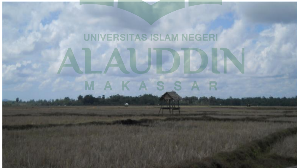
Gambar 10. Tanah Wakaf di Desa Lappae