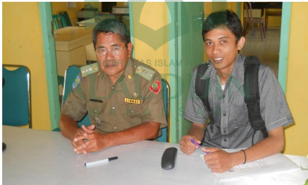
Gambar 2. Foto bersama Kepala Kec. Tellu Siattinge Kabupaten Bone