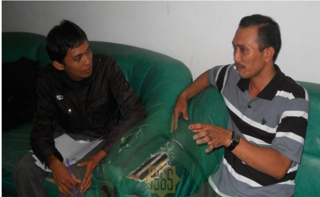
Gambar 5. Foto bersama Kepala Desa Lanca Kec. Tellu Siattinge