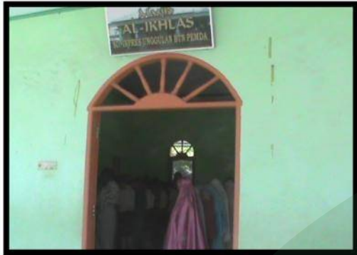
Tampak luar Masjid Al-Ikhlas SD Inpres Unggulan BTN Pemda Makassar