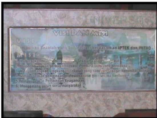
Tugu Visi Misi Sekolah