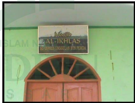
Tampak depan Masjid Al-Ikhlas