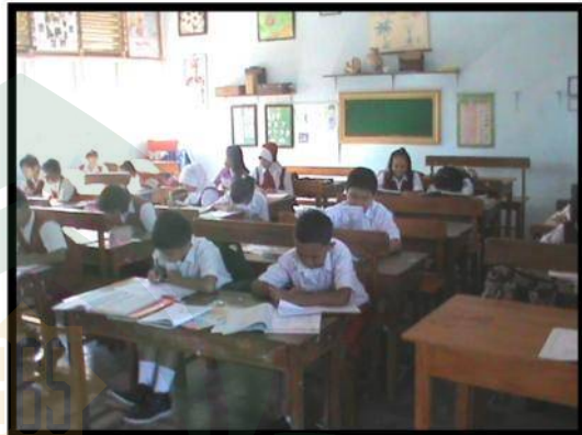
Proses Pembelajaran di Kelas IV SD Inpres Unggulan BTN Pemda Makassar