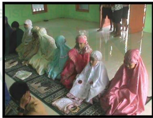
Peserta didik melakukan dzikir dan berdoa setelah melaksanakan salat dzuhur