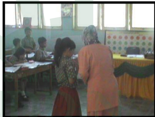
Tampak guru kelas II sedang melaksanakan proses pembelajaran di kelas