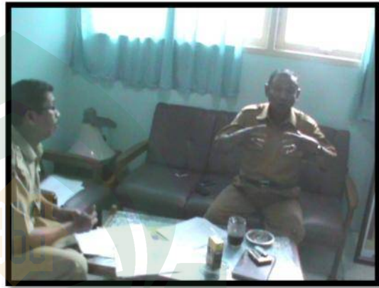
Peneliti saat wawancara dengan Kepala SD Inpres Unggulan BTN Pemda Makassar