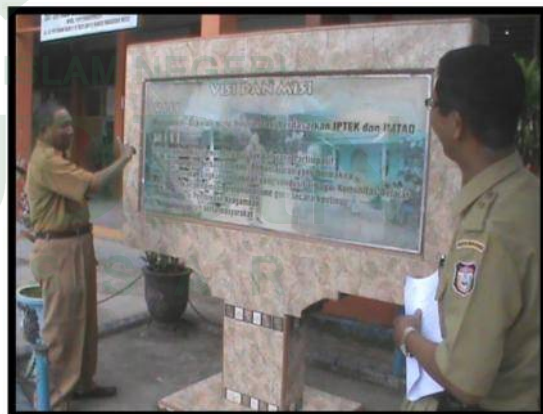
Kepala Sekolah memberikan penjelasan kepada peneliti tentang visi misi sekolah