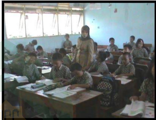
Tampak guru kelas III sedang melaksanakan proses pembelajaran di kelas