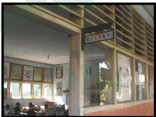
Proses Pembelajaran di Kelas V SD Inpres Unggulan BTN Pemda Makassar