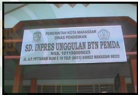
Papan Nama Sekolah SD Inpres Unggulan BTN Pemda Makassar