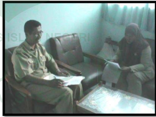
Peneliti saat wawancara dengan Guru PAI SD Inpres Unggulan BTN Pemda Makassar