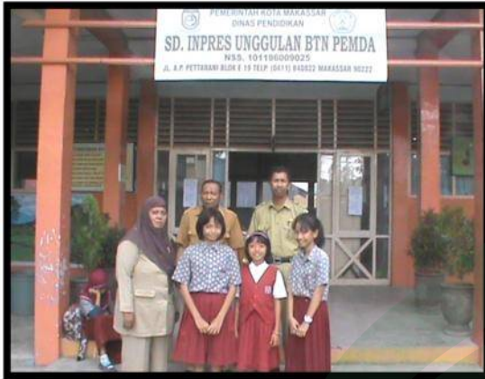
Peneliti bersama Kepala SD Inpres Unggulan BTN Pemda, Guru PAI serta peserta didik informan