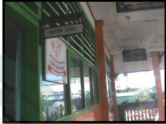
Kantin Sehat Sekolah