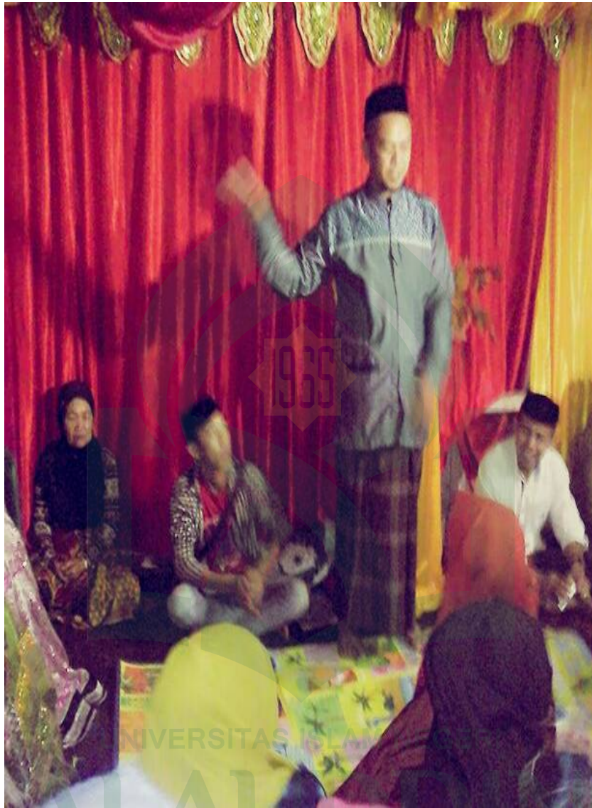
Ceramah nikah dari pak ustadz