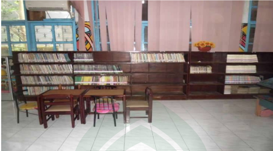
Rak buku pada Ruang Baca Anak-Anak