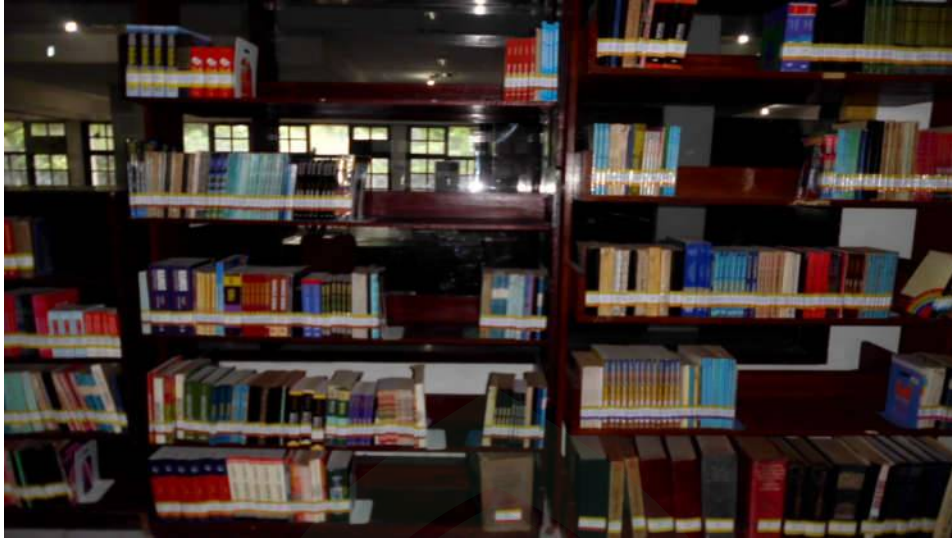
Ruang Baca Referensi