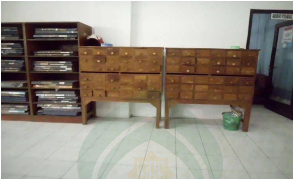
Kursi, Meja, dan Rak pada Ruang Baca Anak-Anak