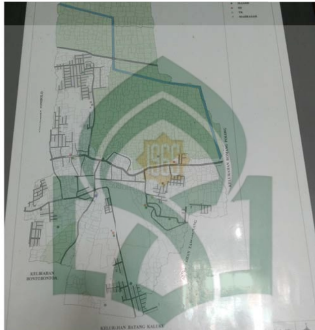
UNIVERSITAS ISLAM NEGERI ALA UDDIN M A K A S S A R Peta Lokasi Kelurahan Paccinongang Kecamatan Somba Opu Kabupaten Gowa.