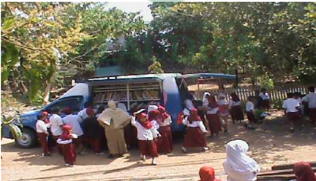
Foto – foto kegiatan pelayanan perpustakaan keliling Perpustakaan dan Arsip Daerah Kabupaten Wajo