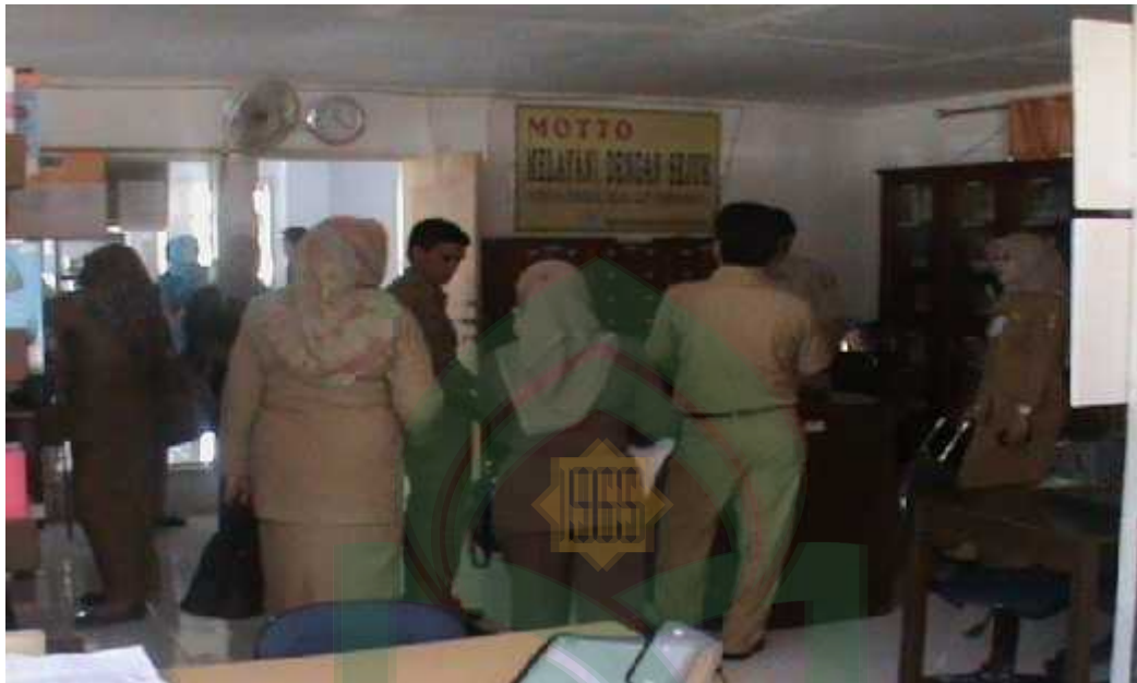
Foto – foto pegawai di Kantor Perpustakaan dan Arsip Daerah Kabupaten Wajo

UNIVERSITAS ISLAMI NEGERI ALAUDDIN M A K A S S A R