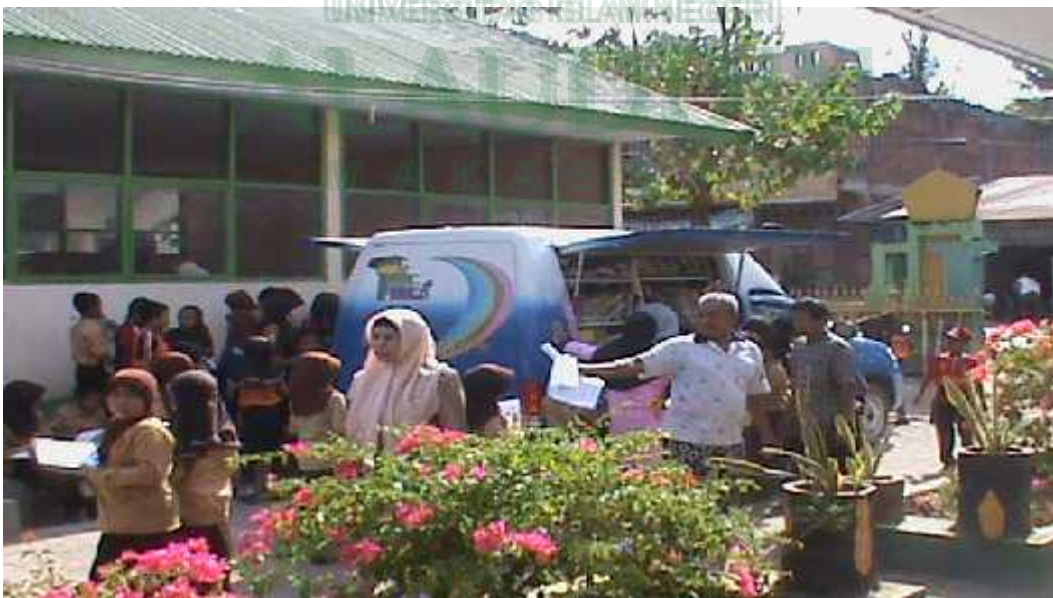
Foto – foto kegiatan pelayanan perpustakaan keliling Perpustakaan dan Arsip Daerah Kabupaten Wajo