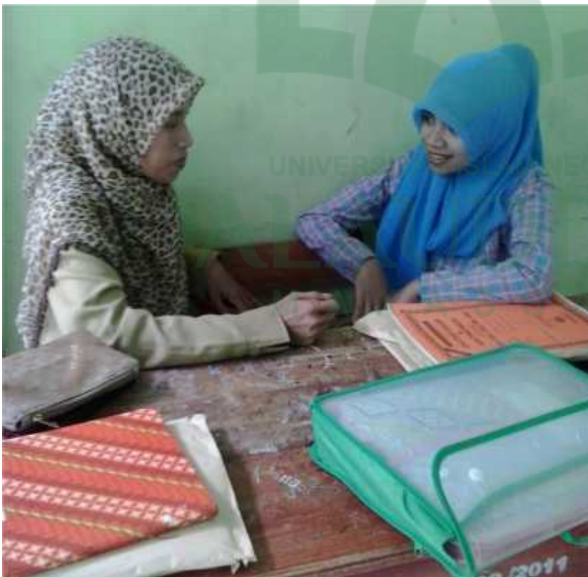
Foto wawancara di salah satu sekolah yang ada di Desa Bontolemangan