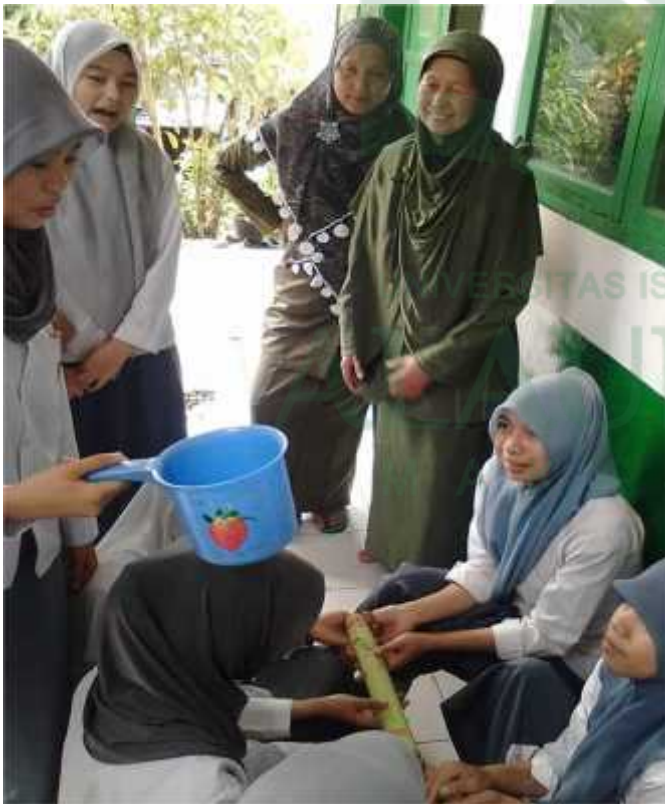
siswa MTS Alhidayah Lemoa Desa Bontolemangan saat raktek memandikan mayat