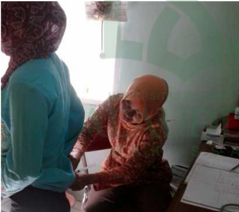
Dokumentasi di salah satu Posyandu yang ada di Desa Bontolempangan