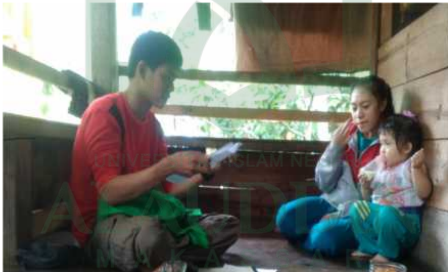
Proses Wawancara dengan Keluarga TKI (Anti, 17 Mei 2017)