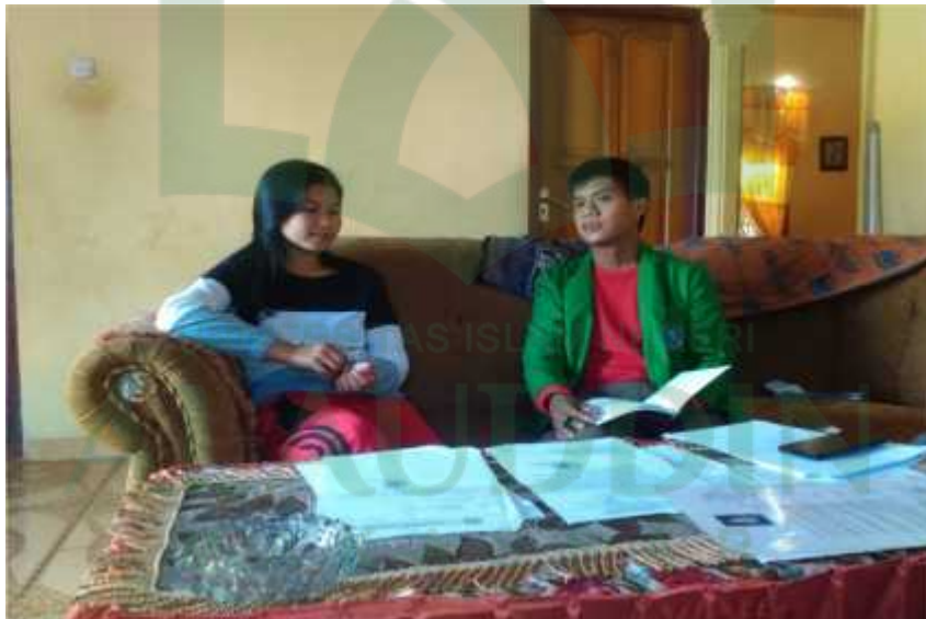
Proses Wawancara dengan Anak TKI (Rini Amriani, 17 Mei 2017)