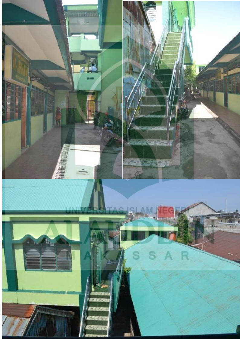
Gambar II: GedungKampus 3