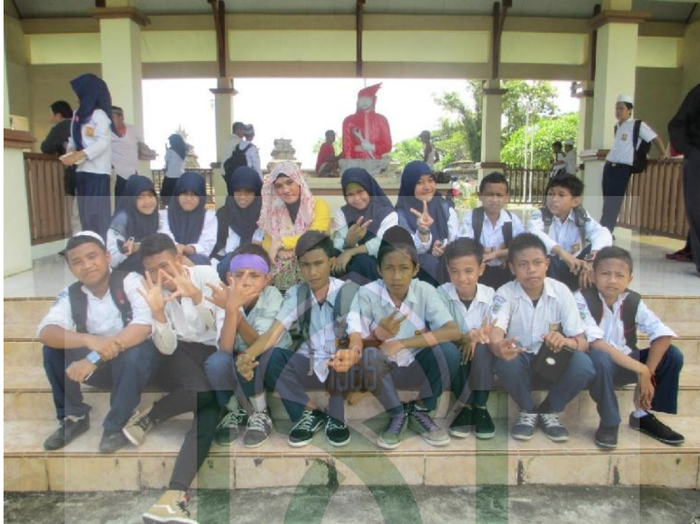
Gambar V : Santri MTS dan MA.