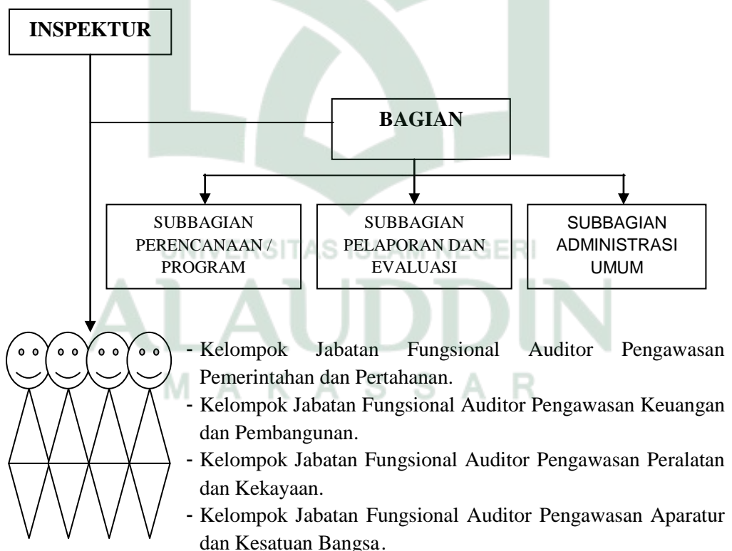
Gambar 2. Bagan Struktur Organisasi Inspektorat Kota Makassar.

Sumber data : Lamp. PERDA Kota Makassar No. 7 Tahun 2010 tentang Pembentukan Susunan Organisasi dan Tata Kerja Inspektorat Kota Makassar (Tahun 2012)