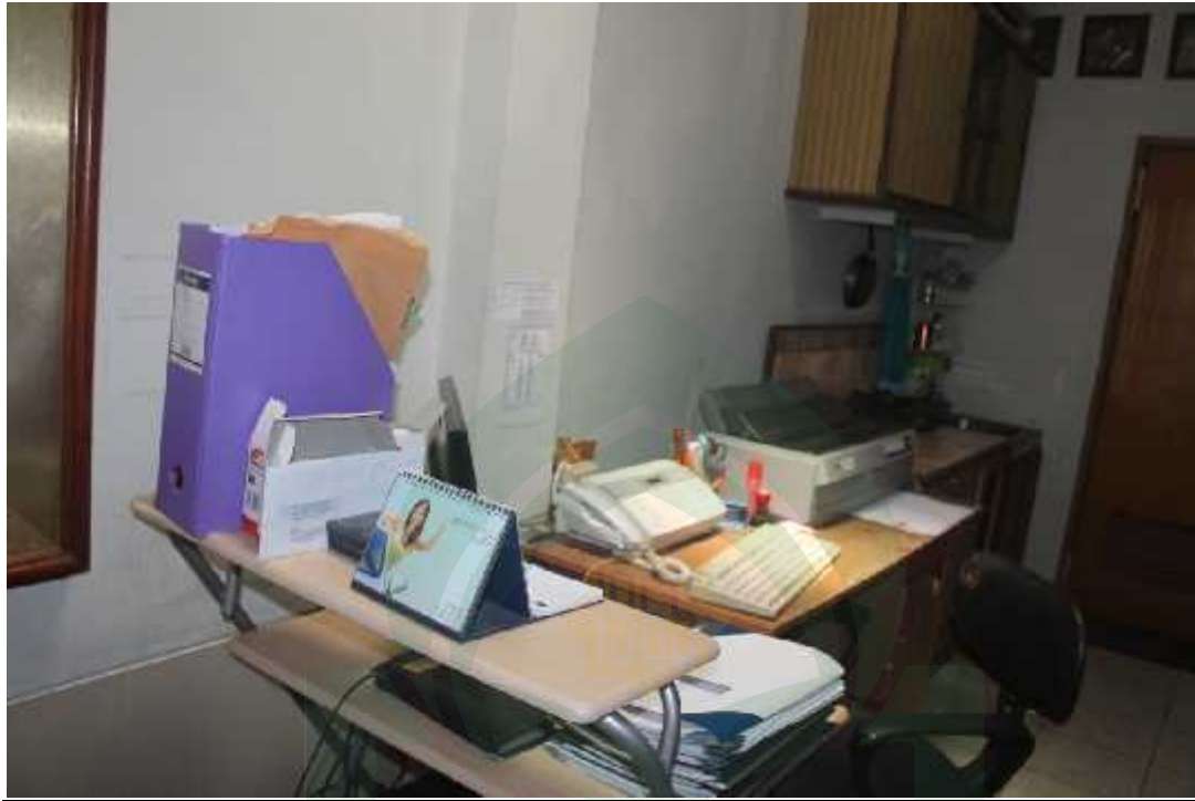
Gambar 1. Inventaris Kantor PT. Caraka Mulia