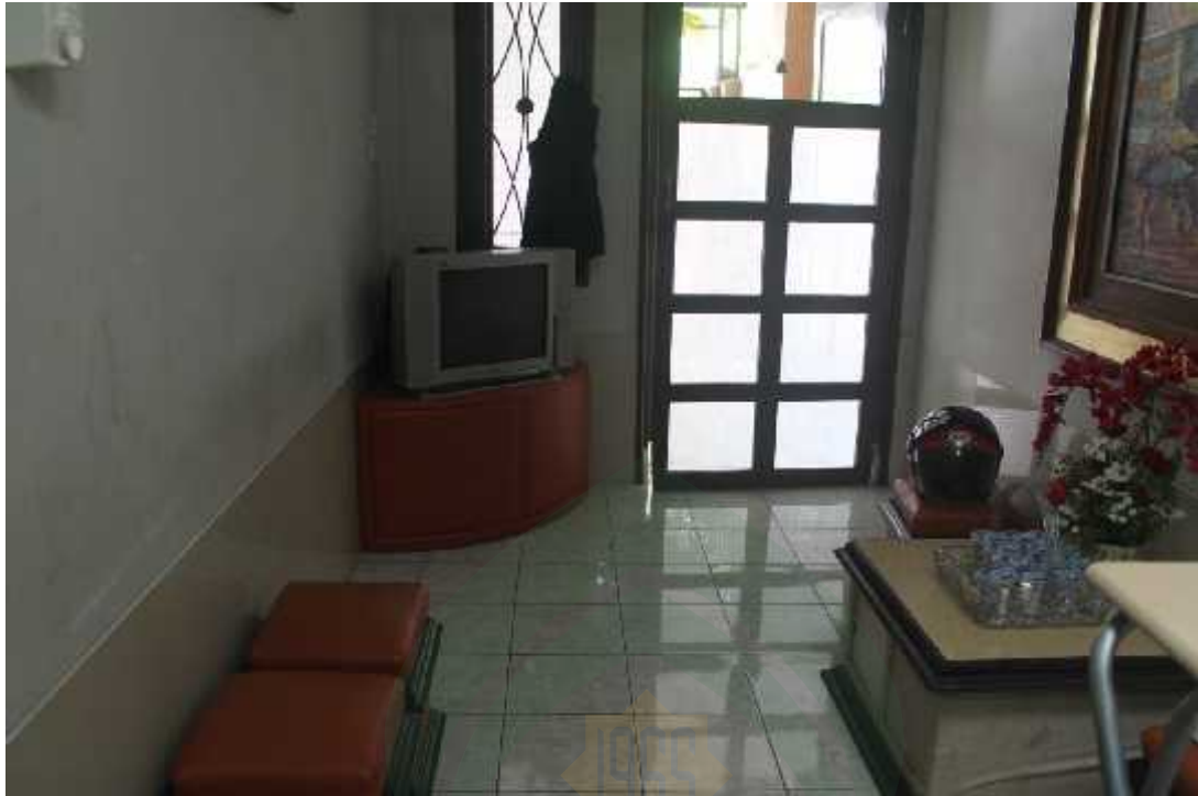
Gambar 3. Inventaris Kantor PT. Caraka Mulia