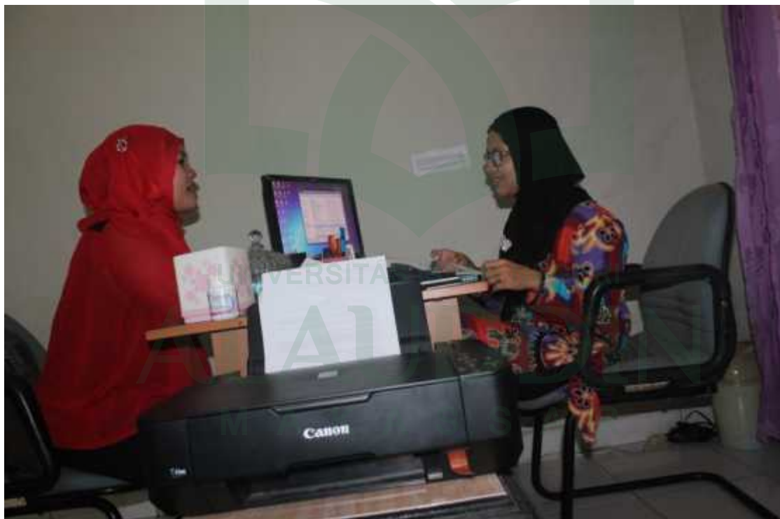
Gambar 6. Wawancara Peneliti dengan Kepala Cab. PT. Caraka Mulia