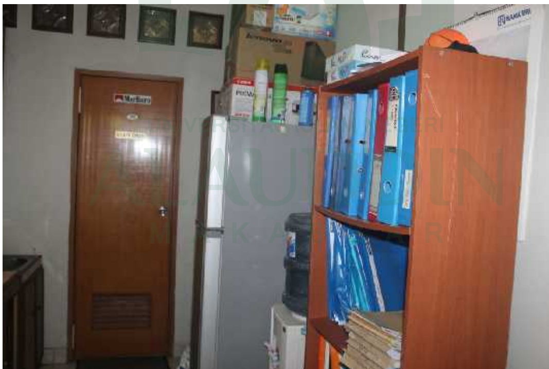
Gambar 2. Inventaris Kantor PT. Caraka Mulia