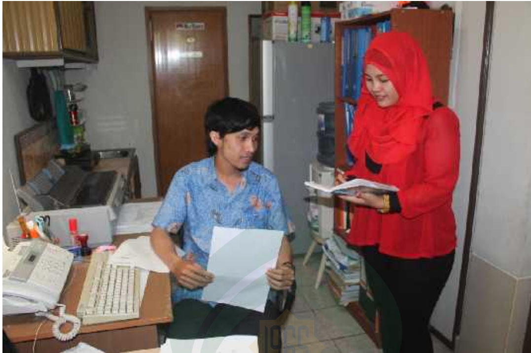
Gambar 7. Wawancara Peneliti dengan Marketing PT. Caraka Mulia

UNIVERSITAS ISLAM NEGERI ALAUDDIN M A K A S S A R