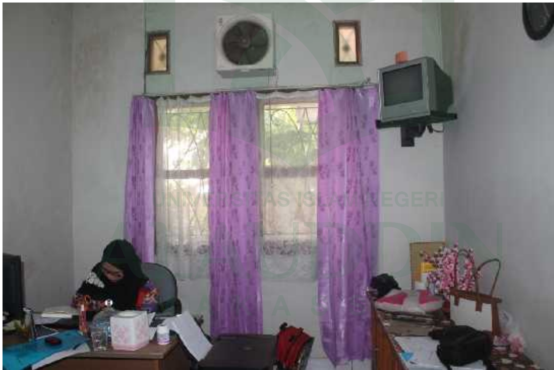
Gambar 4. Ruangan Kepala Cabang PT. Caraka Mulia