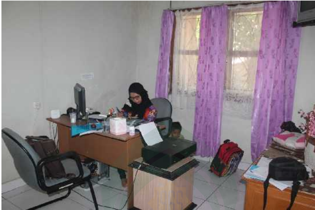
Gambar 5. Ruangan kerja Kepala Cabang PT. Caraka Mulia