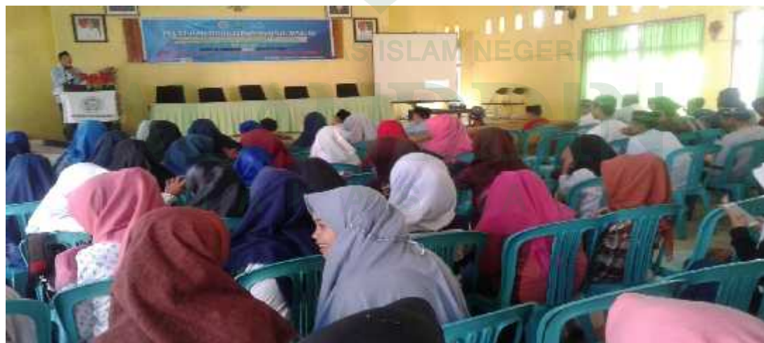
Gambar 7. Suasana Pelatihan Remaja Masjid

Keterangan: Pelatihan manajemen masjid terhadap remaja masjid di aula camat bontomarannu