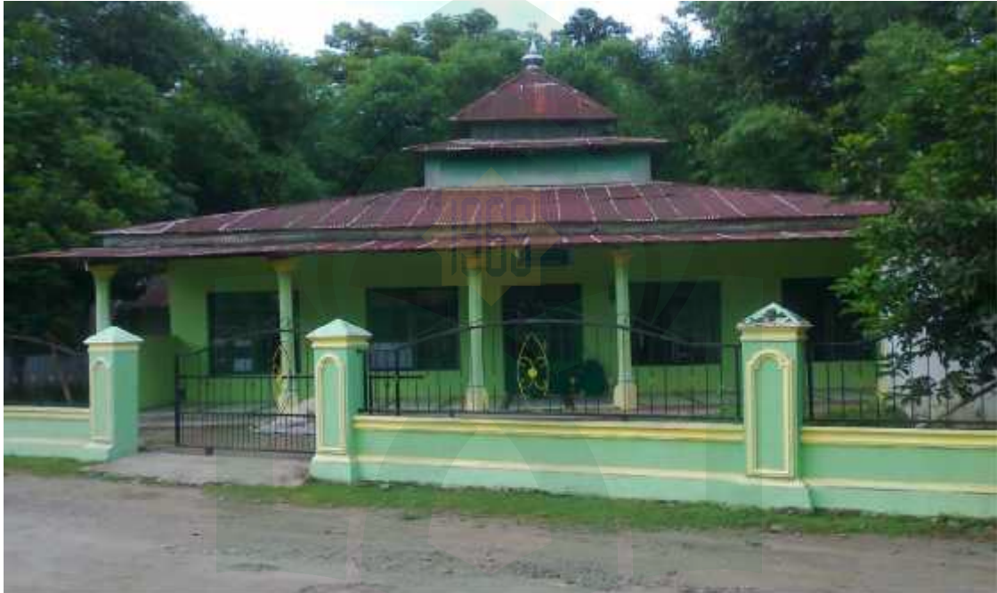
Gambar 1. Masjid Nurul Iman Tahun 1994

Keterangan: Arsip pengurus Masjid Nurul Iman al-Khaer foto Masjid Nurul Iman pada tahun 1994