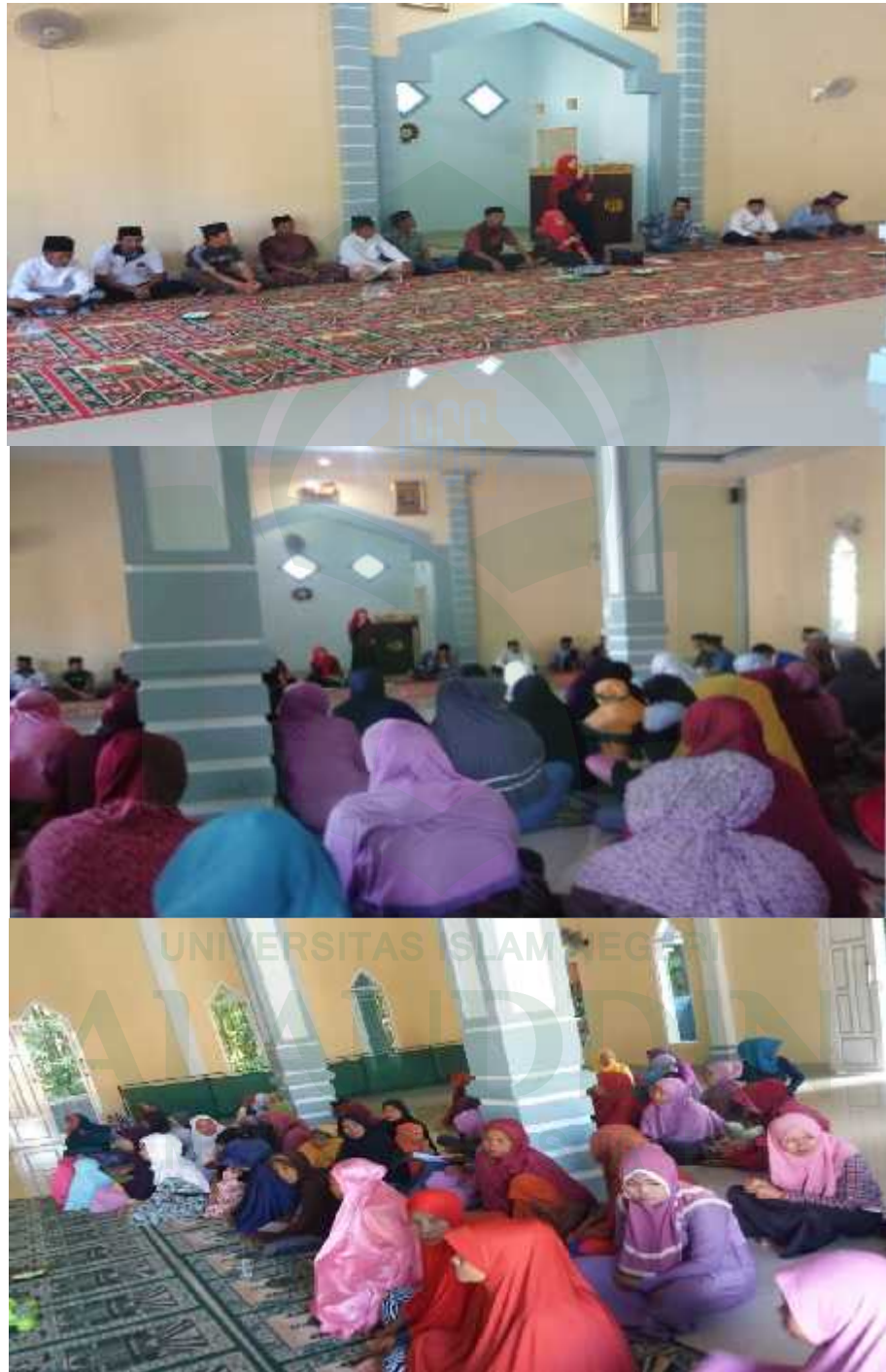
Gambar 8. Suasana Kegiatan Jum'at Ibadah

Keterangan: Foto jamaah kegiatan jum'at ibadah yang dilaksanakan sekali sebulan