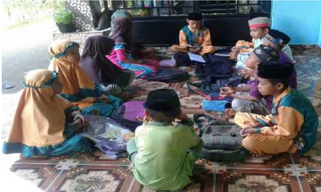
Gambar 6. Suasana kegiatan TKA-TPA Nurul Iman Songkolo

Keterangan: Kegiatan belajar mengaji sore hari pada tanggal 9 juli 2017 di rumah guru TKA-TPA