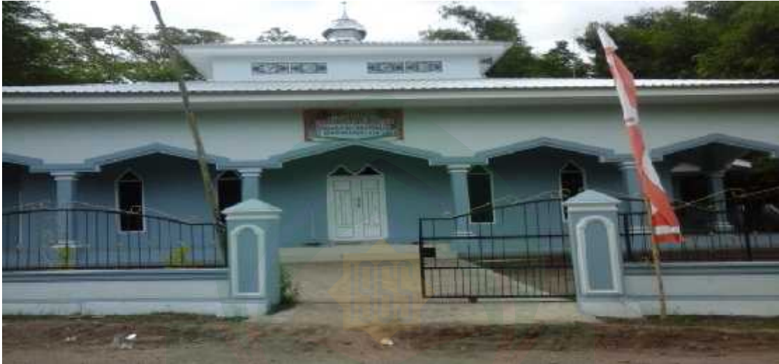
Gambar 2. Masjid Nurul Iman Al-Khaer 2017