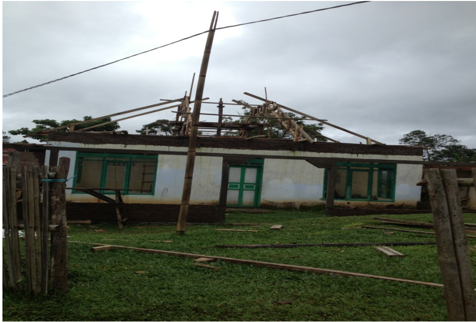
Foto 4: Masjid yang sedang dalam pekerjaan renovasi di Borongbulo

Meskipun penduduk di Borongbulo sebagian besar beragama Islam, tetapi sebagai mayoritas, umat Islam tidak pernah menjadi ancaman bagi kelompok minoritas (umat Kristen) Menurut pak Dusun, selama menjabat sebagai kepala dusun sejak tahun 1990 an, tidak ada konflik besar yang terjadi antara dua penganut agama tersebut. Baik itu dari agama Kristen maupun dari kelompok agama Islam. Hanya saja, sekali lagi tidak jelas bagaimana proses Kristenisasi yang terjadi di Dusun Borongbulo.