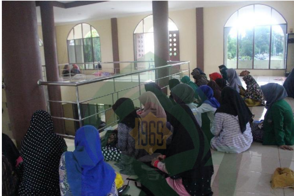
Dokumentasi Ta'lim rutin Aktivis LDK Al-Jami' (Aktivis Akhwat dan Ikhwan Selalu dipisah)