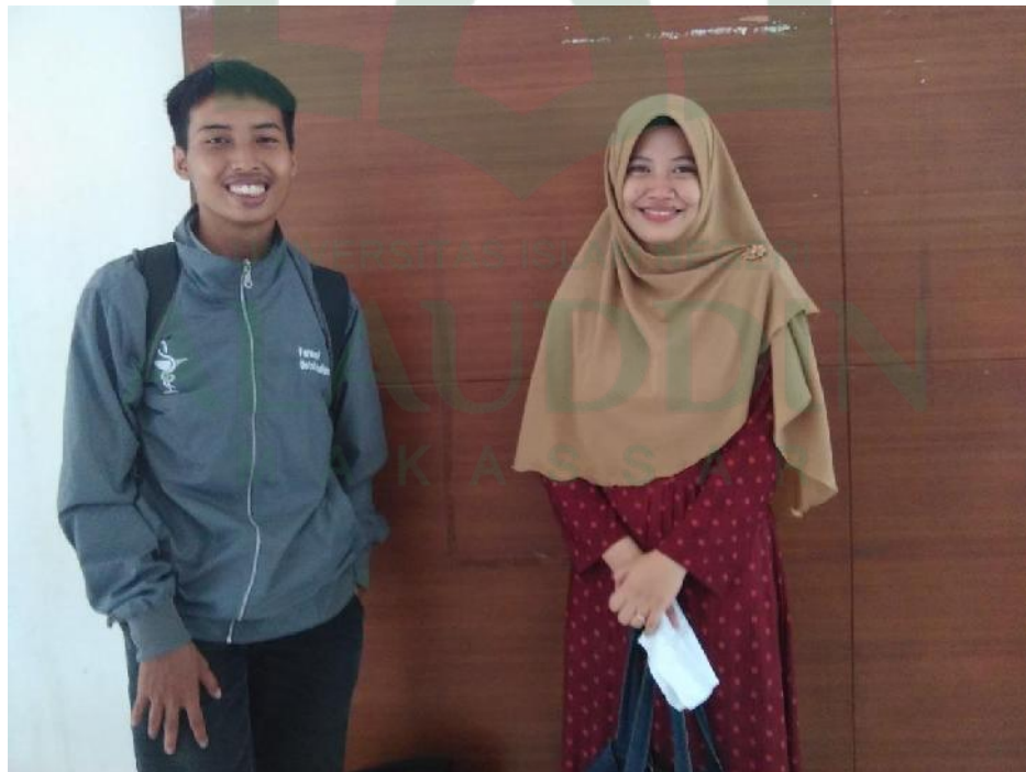
Dokumentasi setelah wawancara bersama Aktivist LDK Al-Jami'