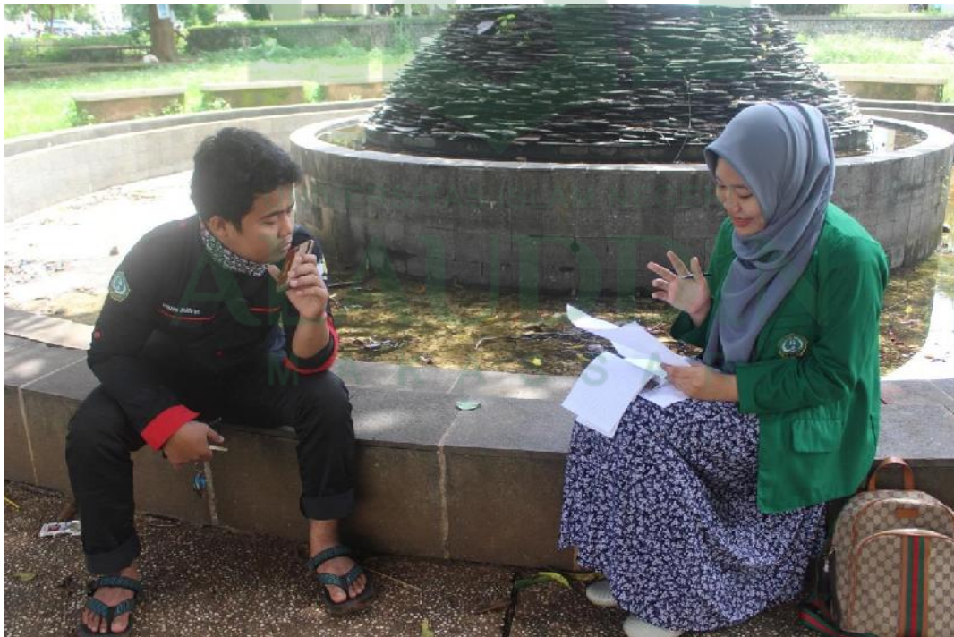
Dokumentasi wawancara. 1