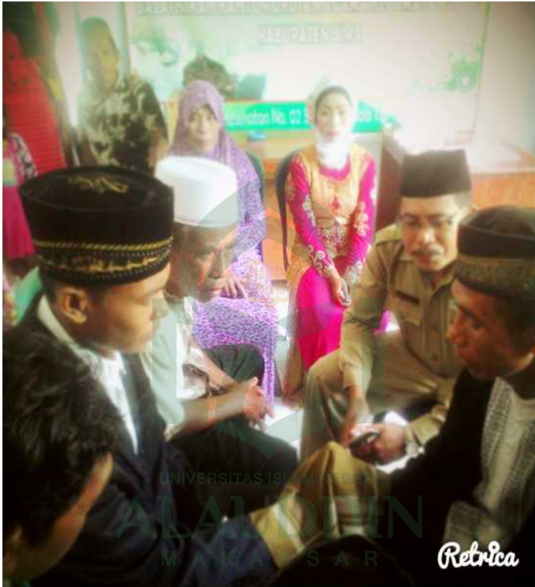
Pada Saat Melakukan Ijab Kabul di Kantor Urusan Agama (KUA) Kecamatan Bolo Kabupaten Bima.