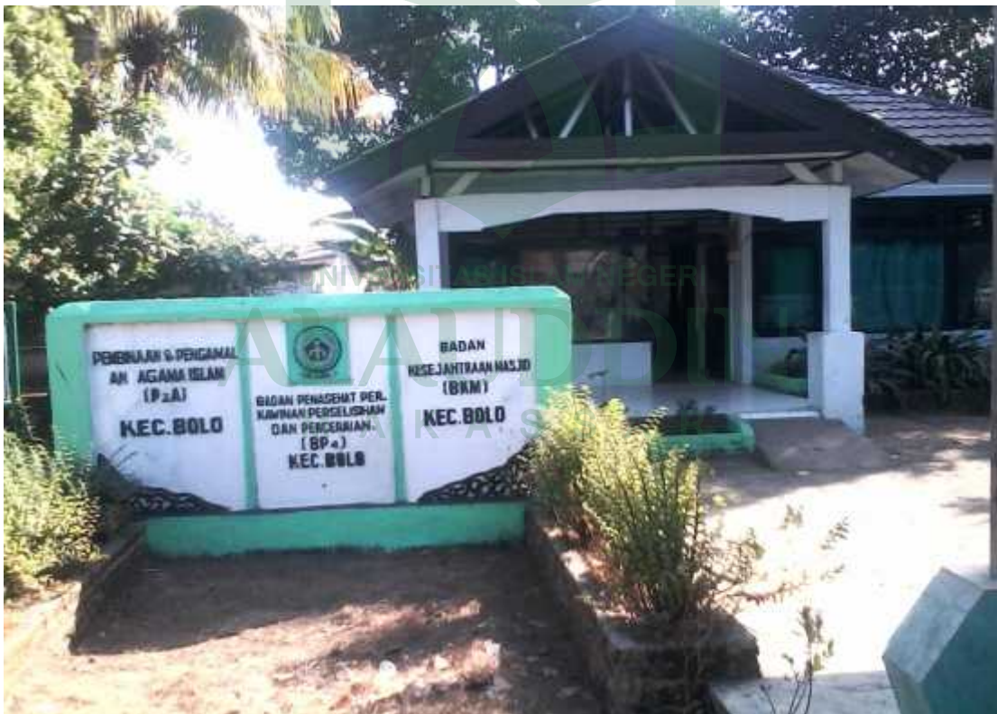
Kantor Urusan Agama (KUA) Kecamatan Bolo Kabupaten Bima.