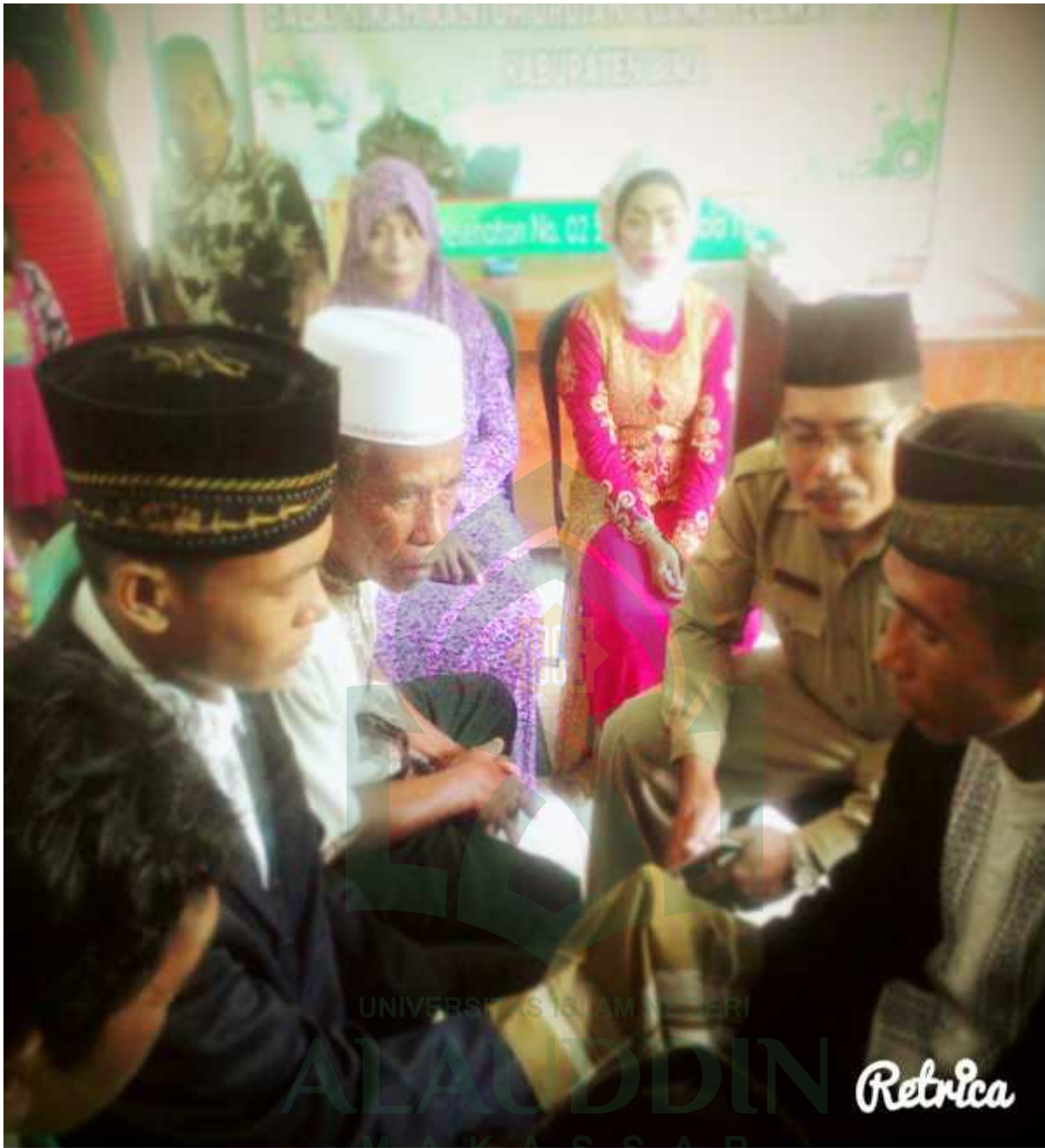
Pada Saat Melakukan Ijab Kabul di Kantor Urusan Agama (KUA) Kecamatan Bolo Kabupaten Bima.