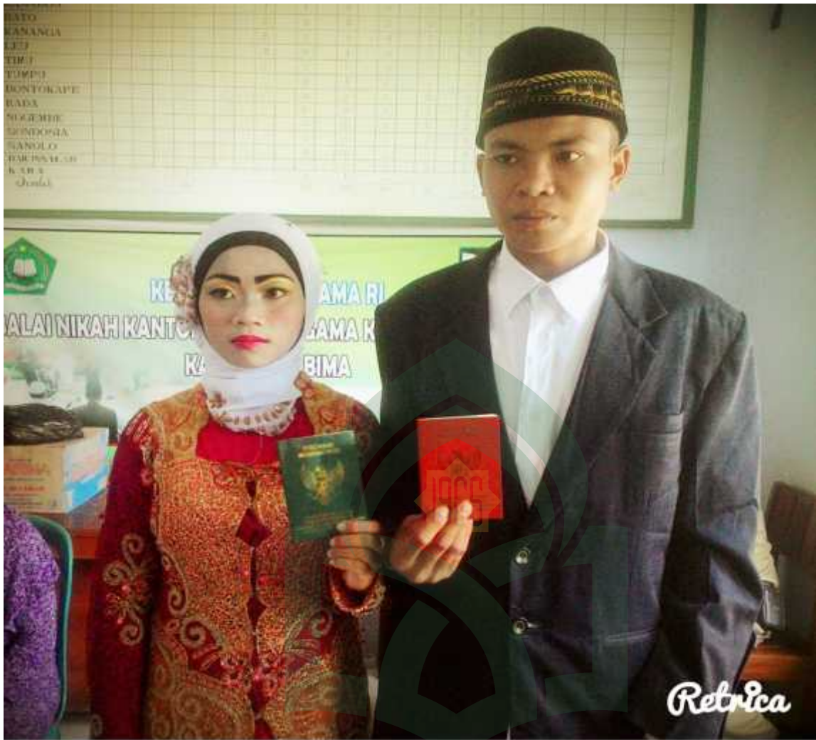
UNIVERSITAS ISLAM NEGERI Pada Saat Menerima Buku Nikah di Kantor Urusan Agama (KUA) Kecamatan Bolo Kabupaten Bima.