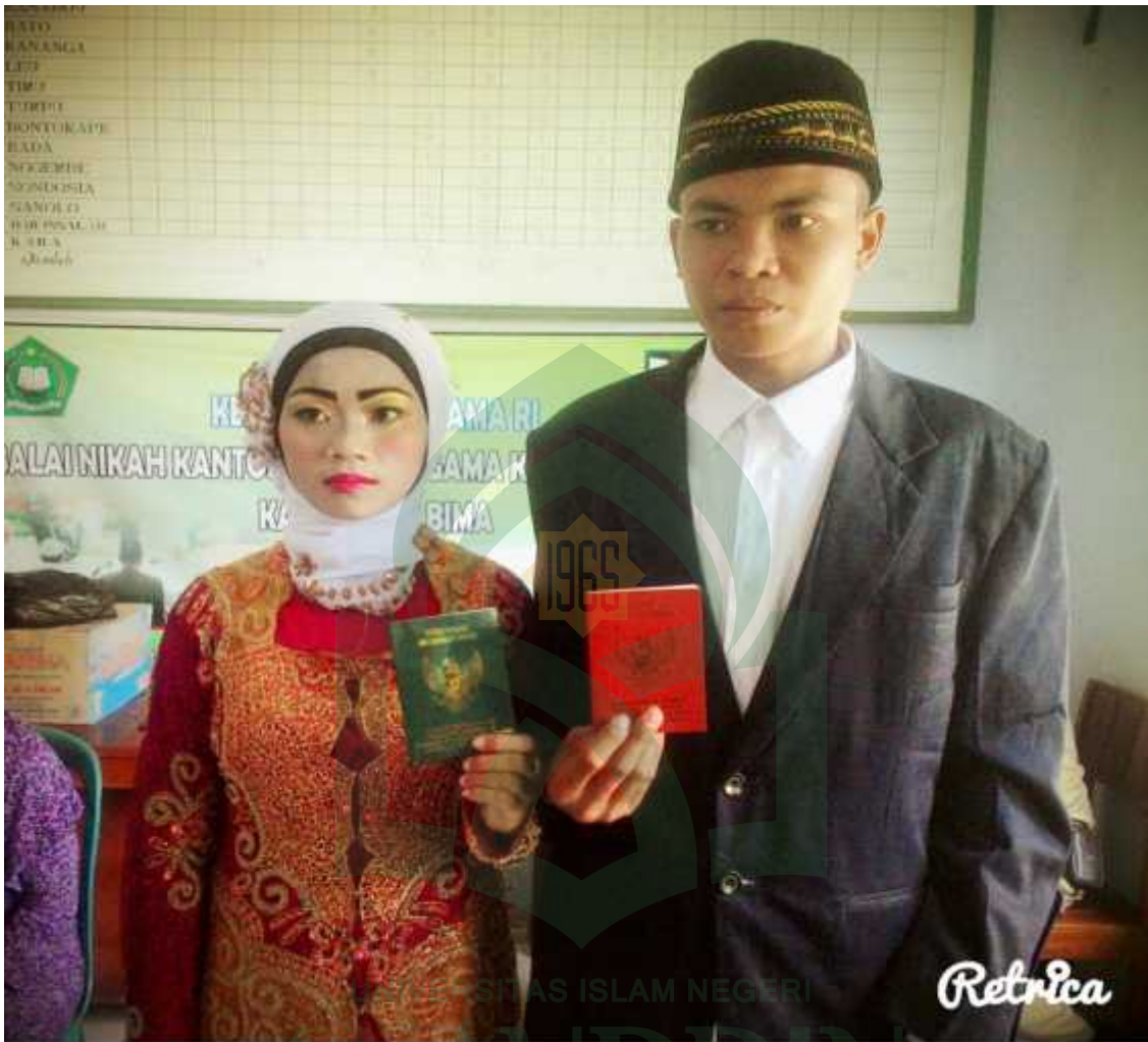
Pada Saat Menerima Buku Nikah di Kantor Urusan Agama (KUA) Kecamatan Bolo Kabupaten Bima.