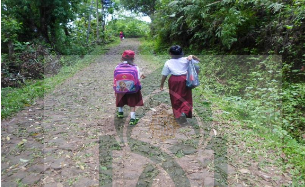
Gambar Kondisi Jalan Dusun Labbabatu