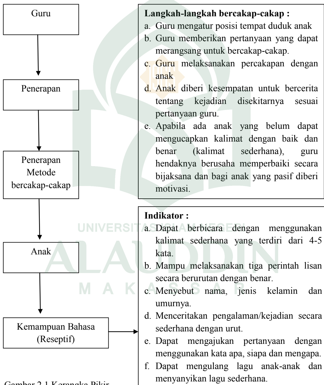
Gambar 2.1 Kerangka Pikir

Berdasarkan hasil di atas akan diujicobakan pengembangan kemampuan bahasa reseptif melalui metode bercakap-cakap tersebut melalui suatu penelitian dengan kerangka skema sebagai berikut :