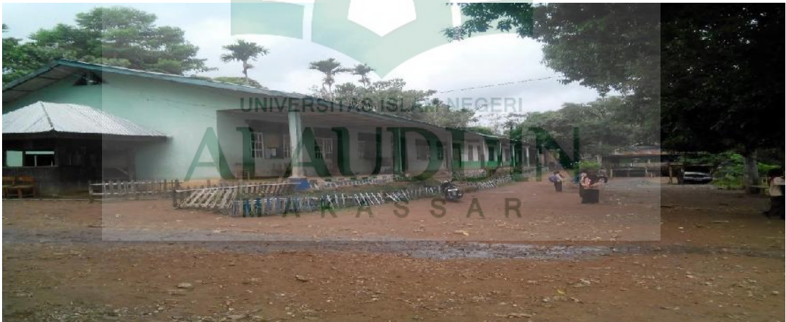
Laboratorium sekaligus Ruang kelas Pondok Pesantren DDI Nurussalam Lassa Lassa