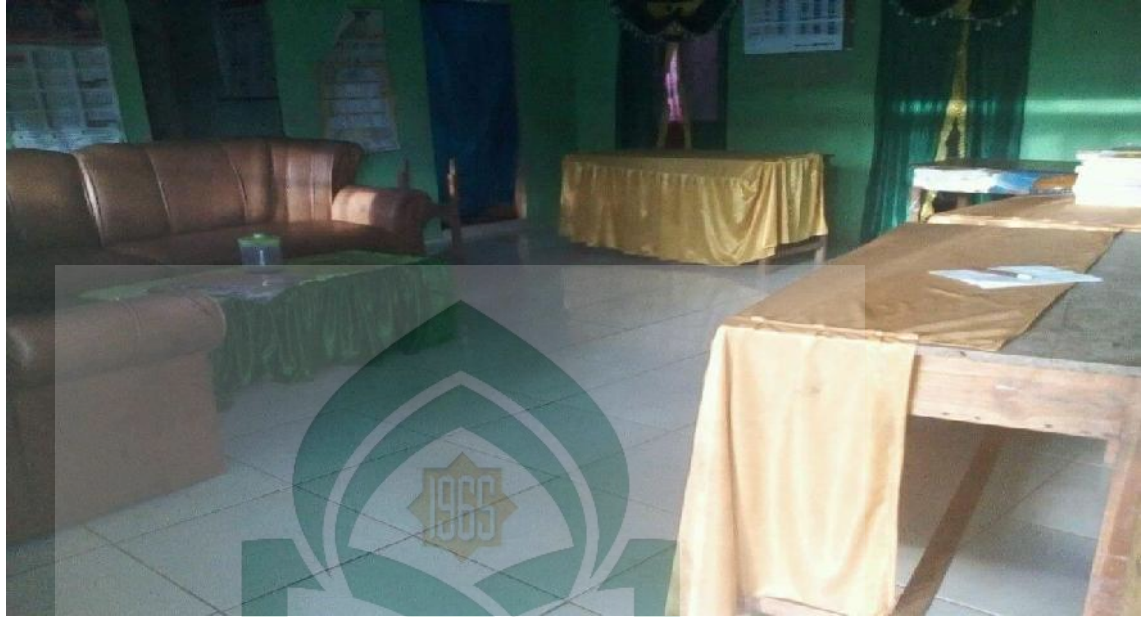
Kantor Pondok Pesantren DDI Nurussalam Lassa Lassa