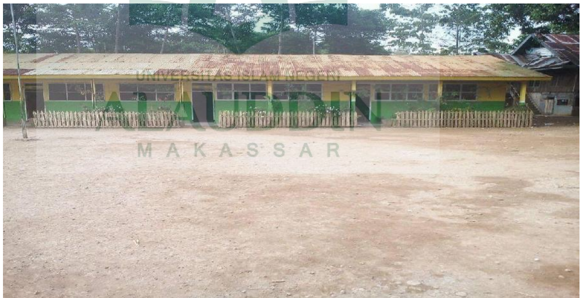
Ruang Kelas Pondok Pesantren DDI Nurussalam Lassa Lassa