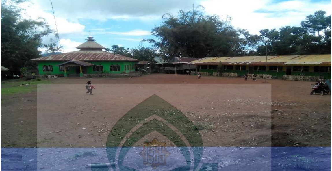
Lapangan Olahraga Pondok Pesantren DDI Nurussalam Lassa Lassa