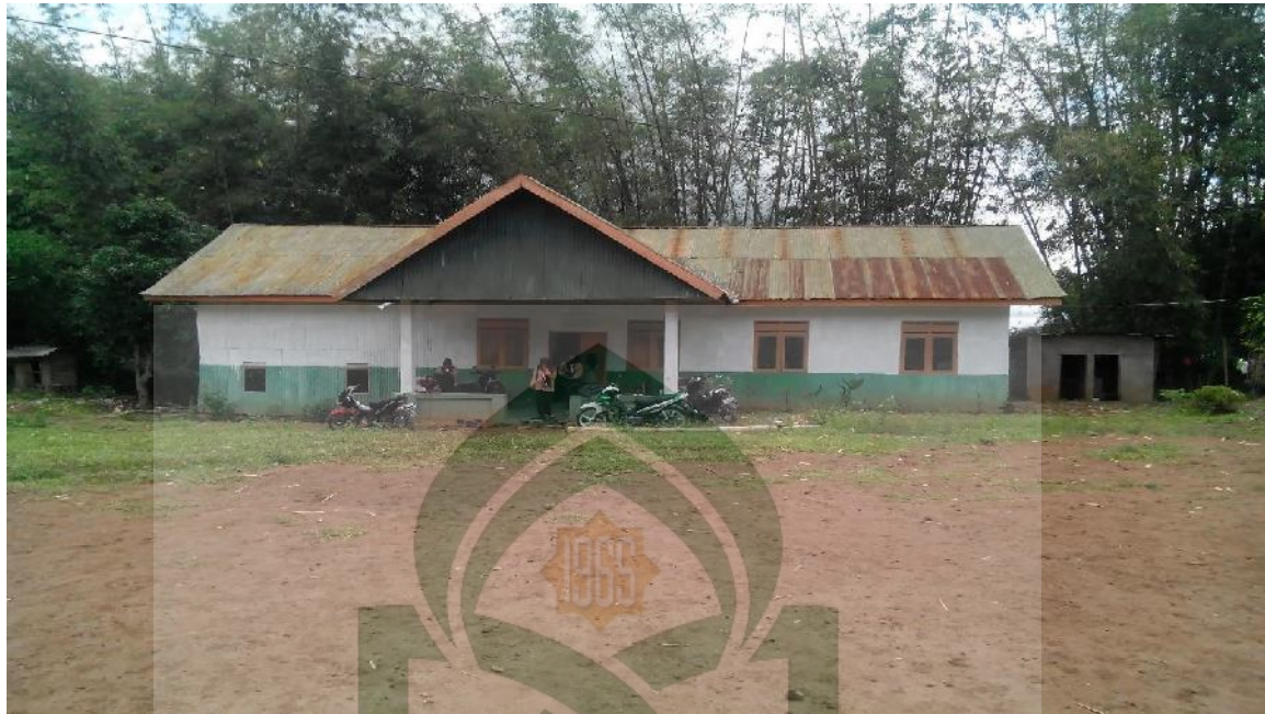
Asrama Pondok Pesantren DDI Nurussalam Lassa Lassa

UNIVERSITAS ISLAM NEGERI ALAUDDIN M A K A S S A R