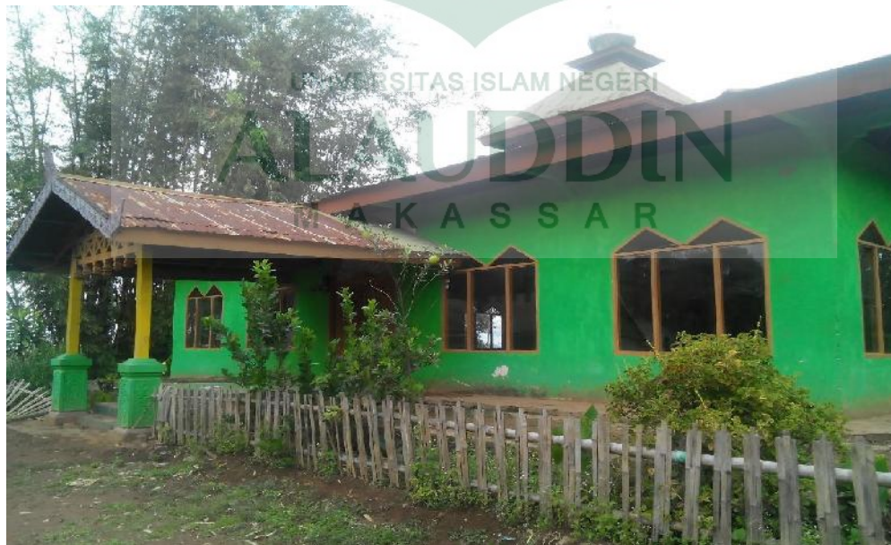
Masjid Pondok Pesantren DDI Nurussalam Lassa Lassa