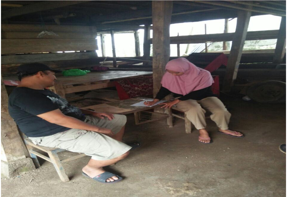
Wawancara dengan Sultan(42 Tahun), 16 Juli 2017