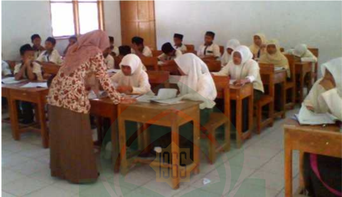
Observasi pelaksanaan proses pembelajaran Akidah Akhlak MAN Binamu Jeneponto.