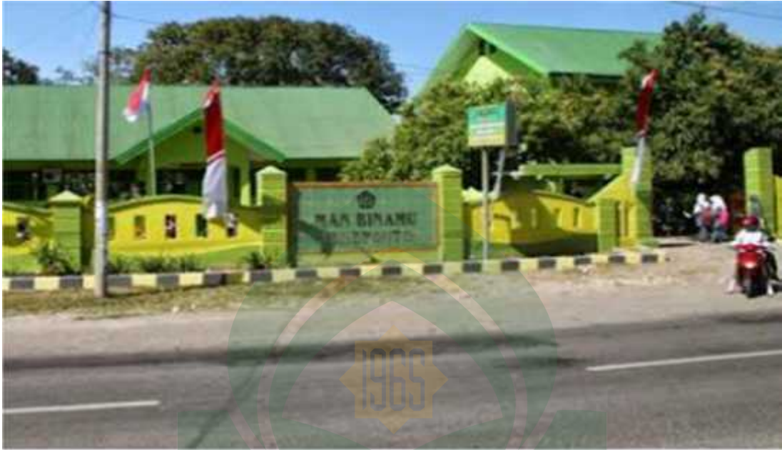
MAN Binamu Jeneponto