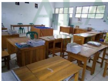
Ruang Kepala Sekolah