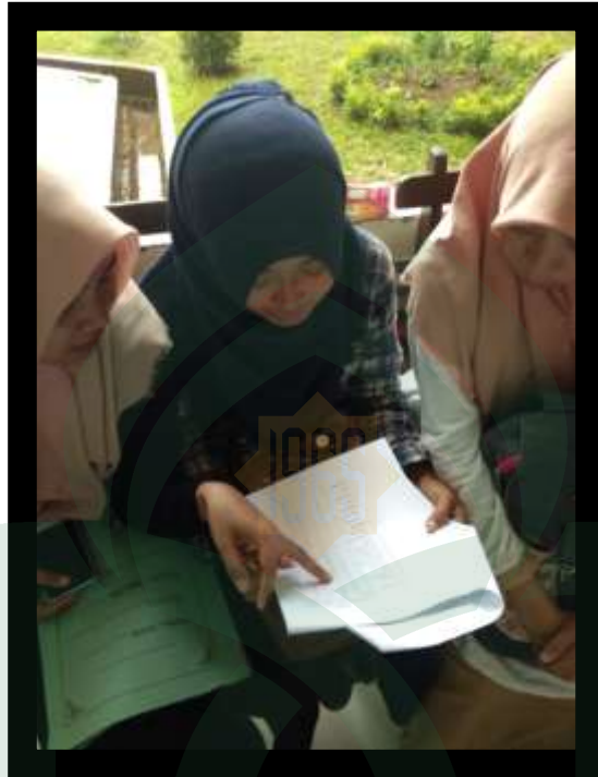
Gambar: Pengisian angket oleh salah satu responden