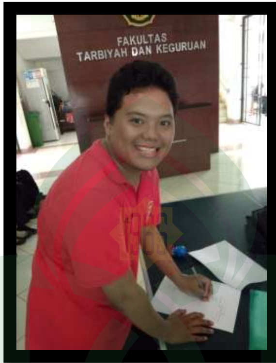
Gambar: Setelah pengisian angket oleh salah satu responden