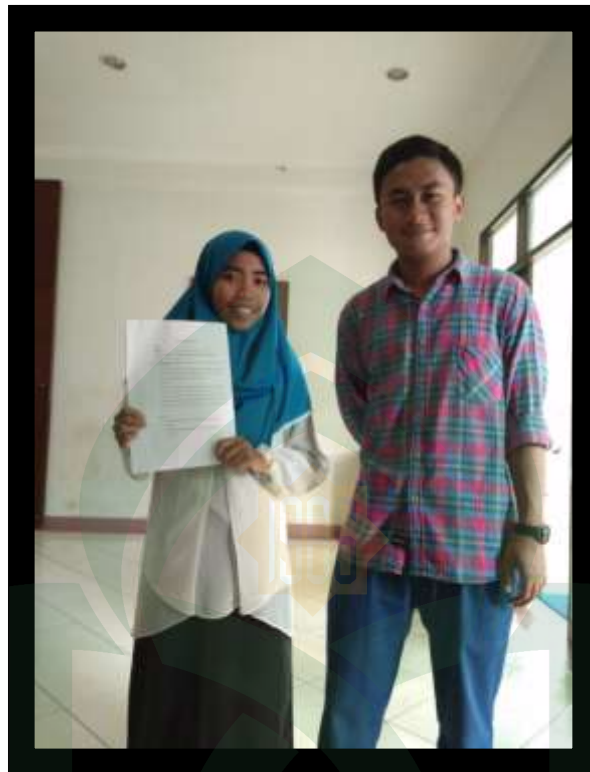
Gambar: Setelah pengisian angket oleh salah satu responden