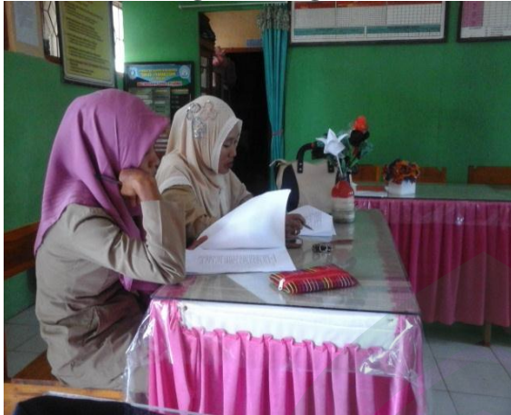
Gambar 4: Pengisian Angket