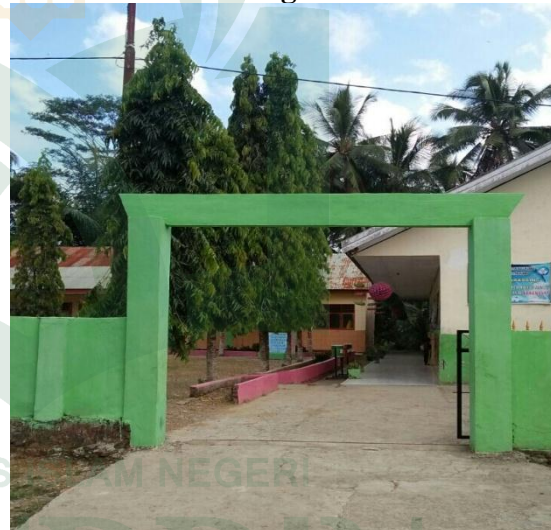
Gambar 2 : Gerbang Sekolah