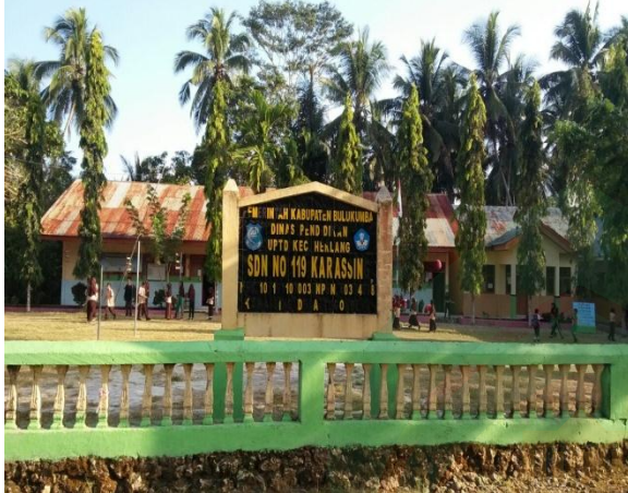
Gambar 1 : SDN No. 119 Karassing