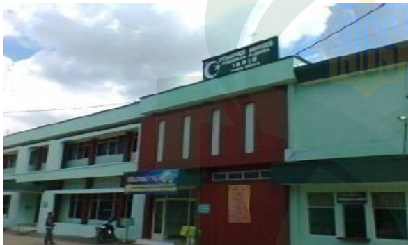
Pesantren IMMIM Putra