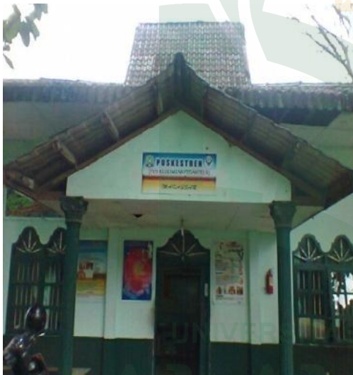
Poskestren Pesantren IMMIM Putra