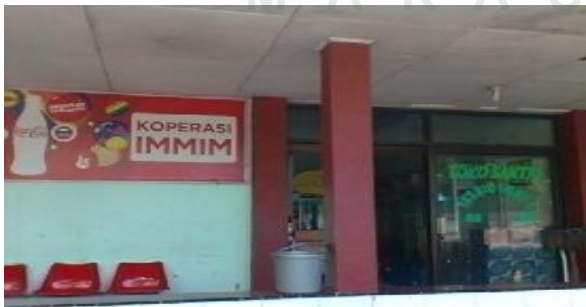
Koperasi IMMIM Putra