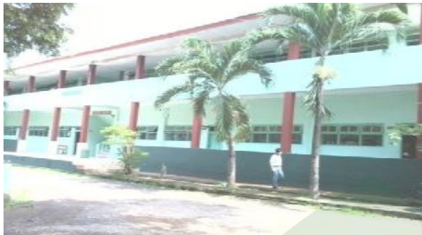
Sekolah IMMIM Putra