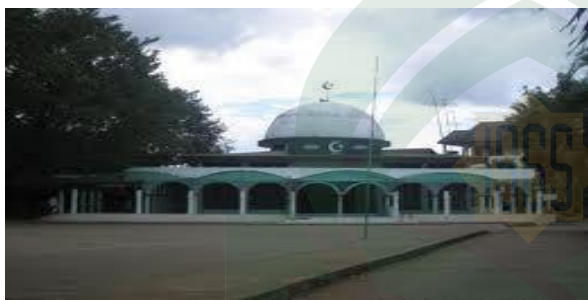
Mesjid IMMIM Putra