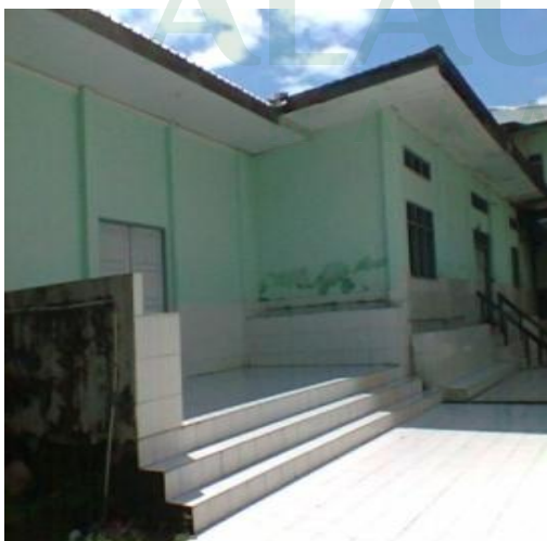
Dapur Pesantren IMMIM Putra