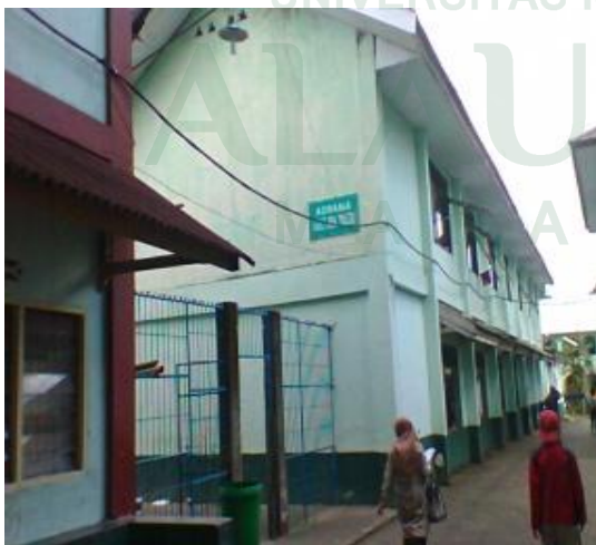
Asrama Panglima Polem