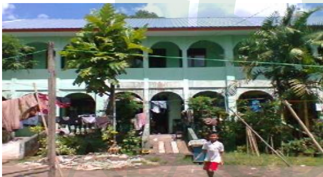
Perumahan Pondok Pesantren