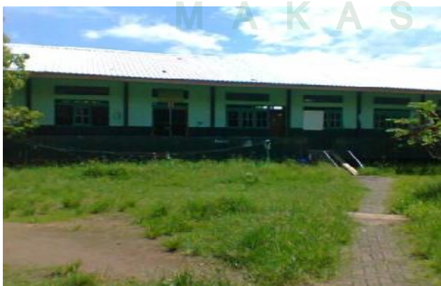
Asrama Ibnu Khaldun