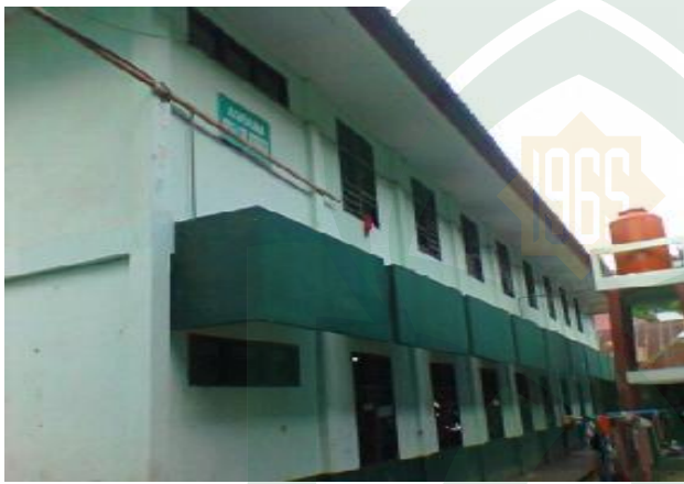
Asrama Syech Yusuf