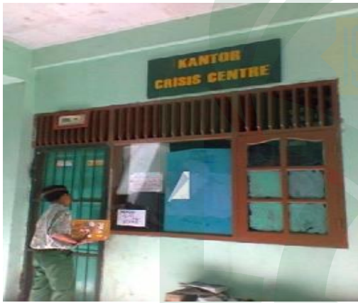
Kantor Crisis Centre