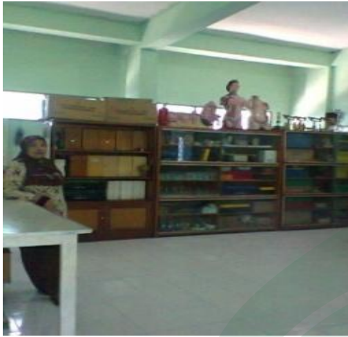
Laboratorium Pesantren IMMIM Putra