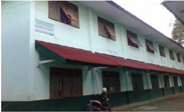
Asrama Fadelil Luran