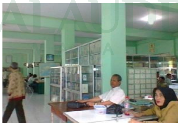
Perpustakaan Immim Putra