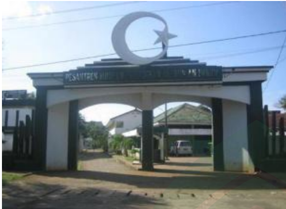
Gerbang Pesantren IMMIM Putra