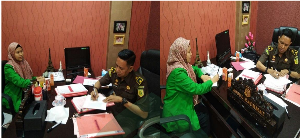
(Wawancara mengenai proses pelelangan) Pada tanggal 17 Oktober 2017 Pukul 12:17 Wita