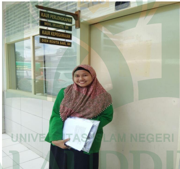
Berfoto depan ruangan yang menangani proses pelelangan Pada tanggal 17 Oktober 2017 Pukul 10:11 Wita