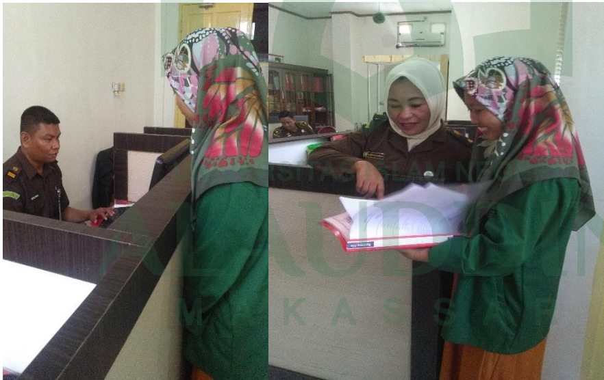
Menunggu surat hasil penelitian Pada tanggal 24 Oktober Pukul 09:46 Wita