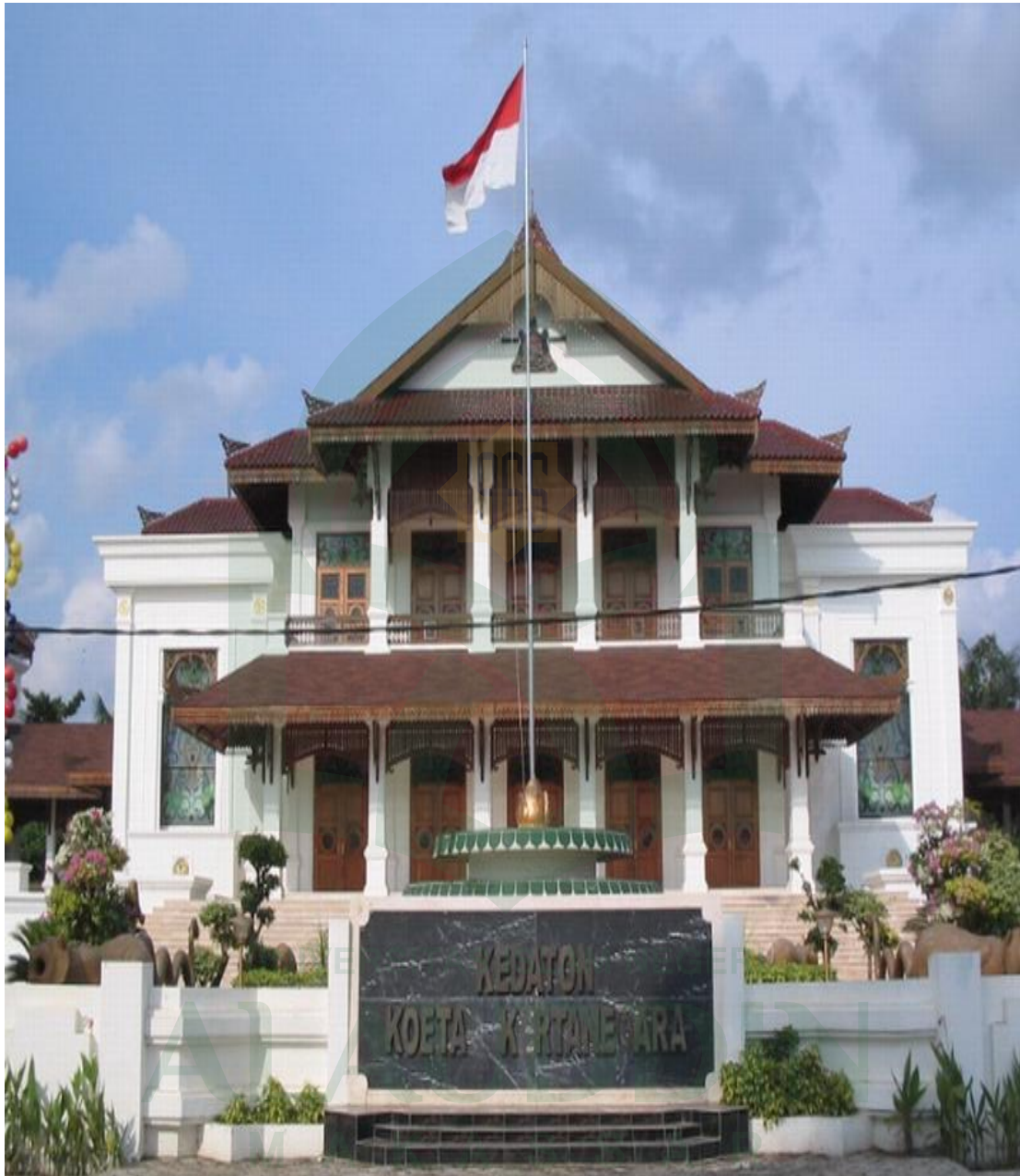
Keraton Kesultanan Kutai Kertanegara.