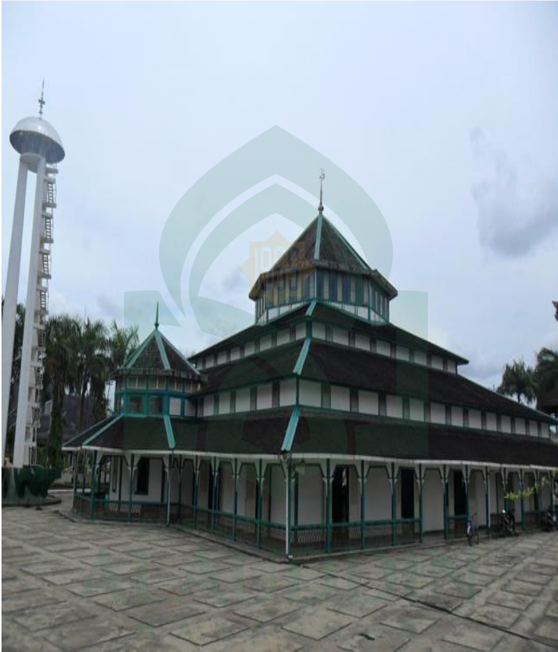
Masjid Jami Hasanuddin yang dibangun pada tahun 1874 Oleh Raja Sultan Sulaiman.