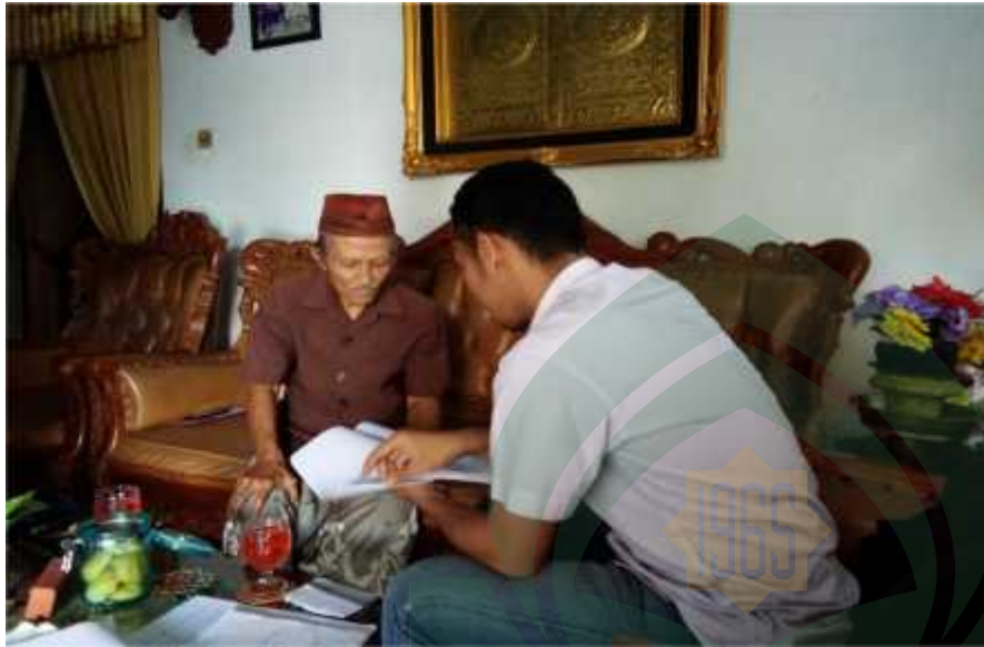
Foto Setelah Wawancara