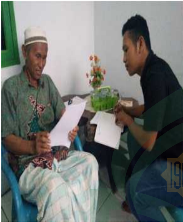
Foto Setelah Wawancara