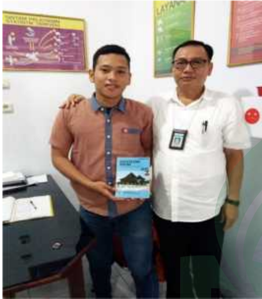
foto saat meminta Data BPS Kecamatan Somba opu

Foto setelah meminta Data BPS Kabupaten Gowa