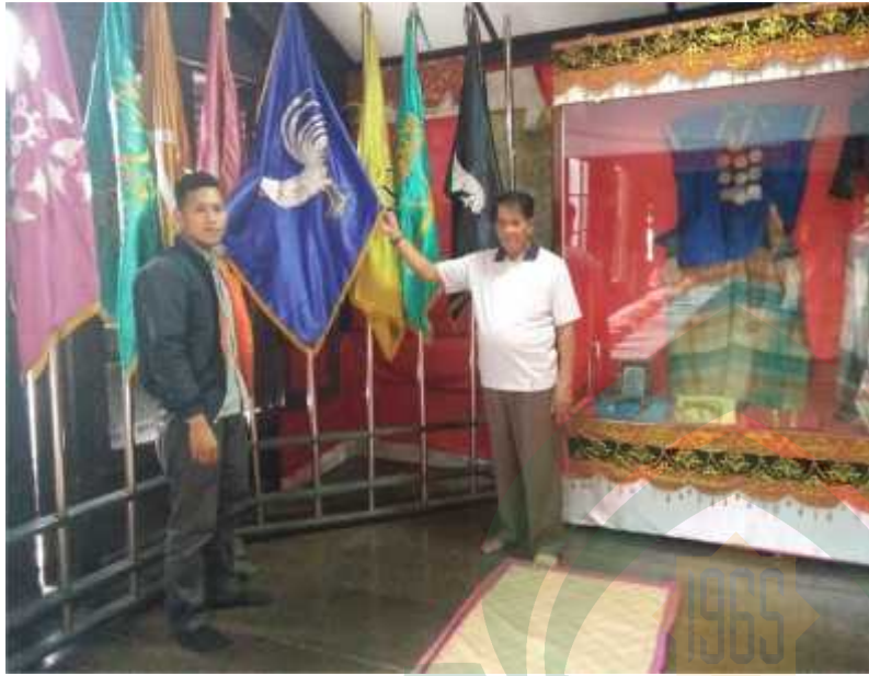
Foto Bendera Atau Panji Kebesaran Bate Salapang Di Museum Balla Lompoa