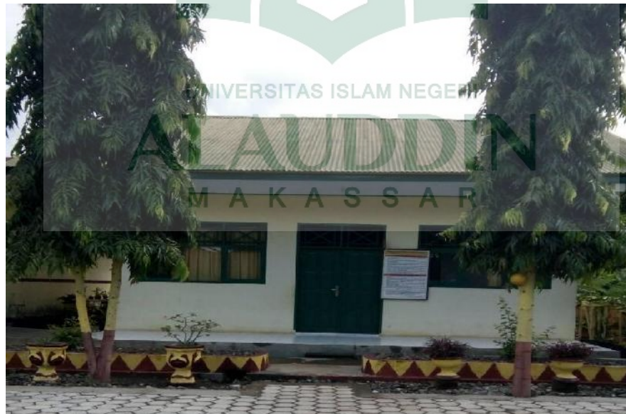
Perpustakaan SDN 45 Toddang Saloe