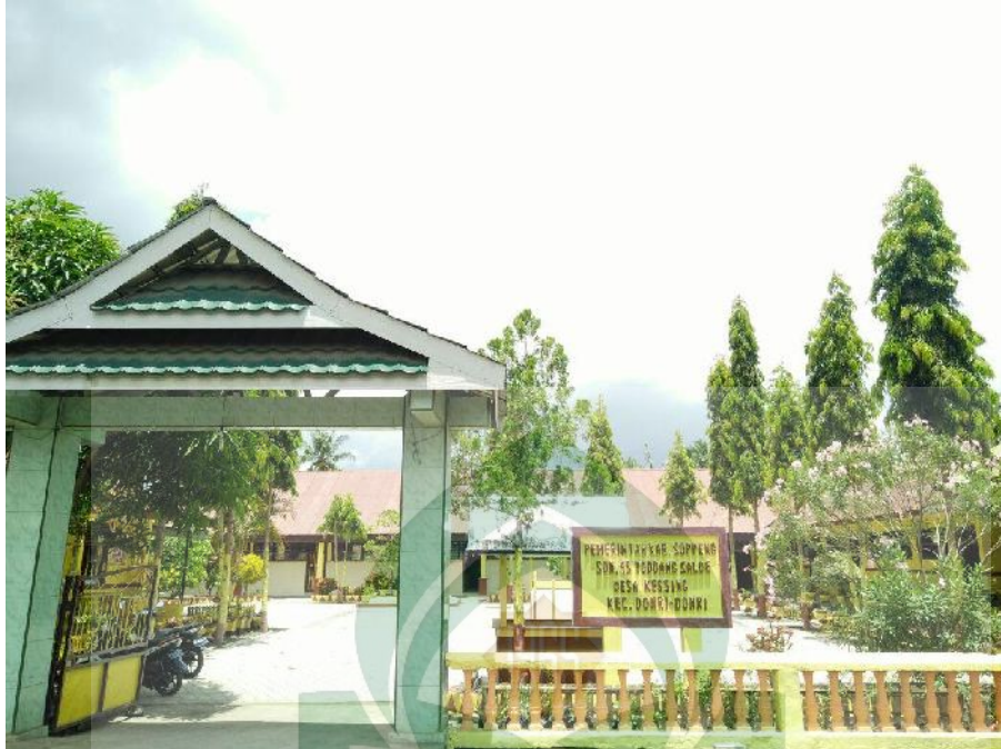
Lokasi Penelitian : SDN 45 Toddang Saloe