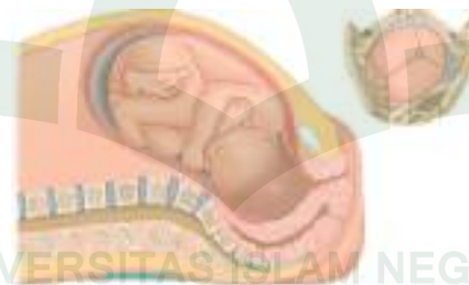
Gambar 2.1 Fleksi, dagu dibawah lebih dekat ke arah dada janin ( Google Image ).