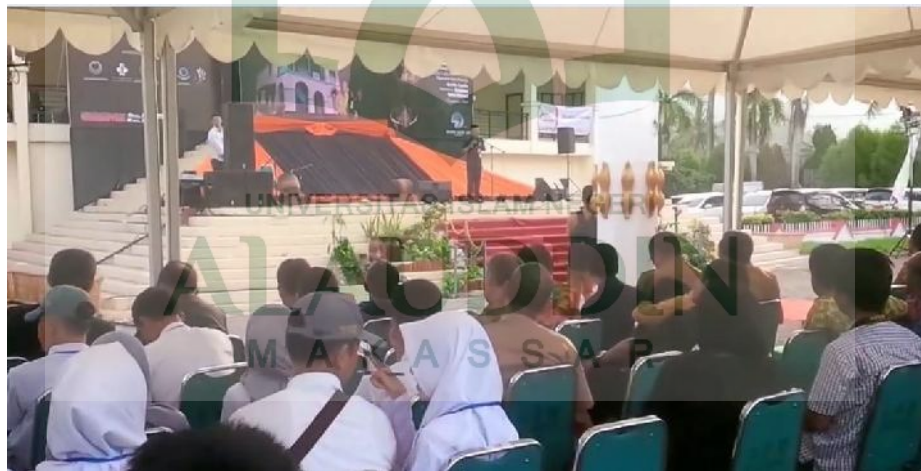
Suasana peserta saat pemberian materi Archeological Partnerships Expose (Pagelaran Kemitraan Arkelogi) pada bulan Afril 2016 di lapangan Gasis