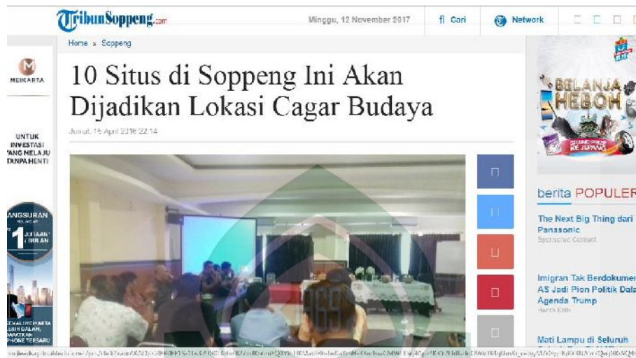
Salah satu pemberitaan di Tribun Soppeng tentang cagar budaya