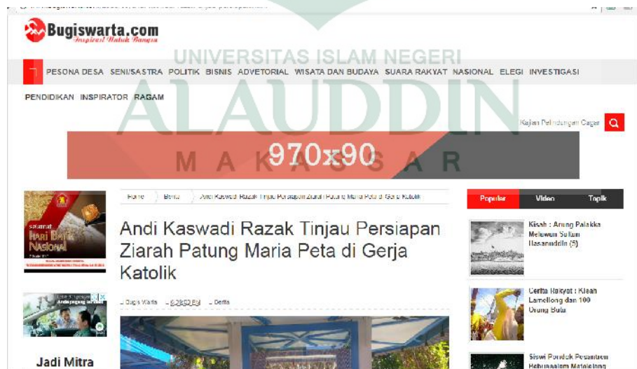
Salah satu pemberitaan di Bugis Warta tentang cagar budaya