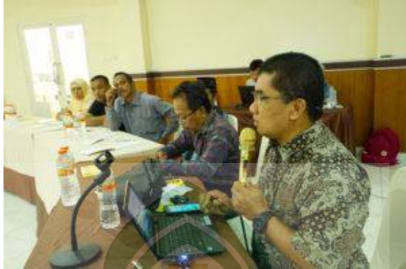
Suasana saat pemberian materi seminar yang bertajuk “Kajian Pelindungan Cagar Budaya Kawasan Lembah Walanae, Kabupaten Soppeng, pada hari senin, 14 Agustus 2017, di hotel Grand Saota, kabupaten Soppeng