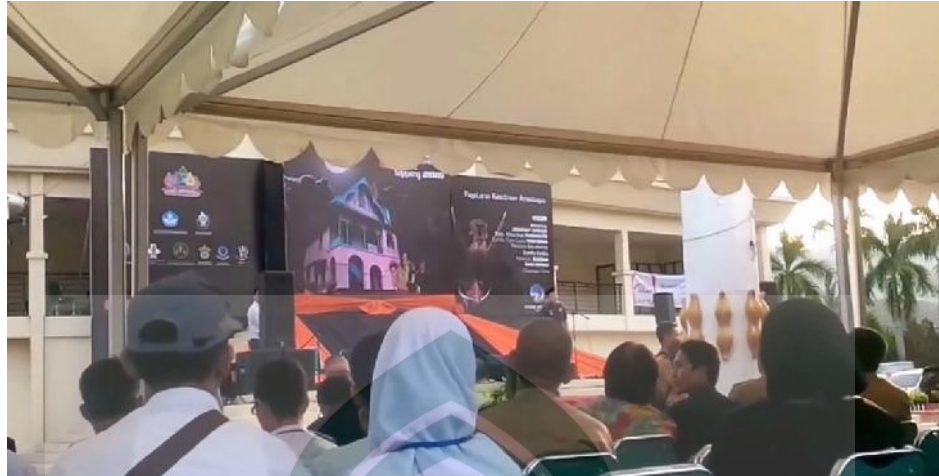
Suasana peserta saat pemberian materi Archeological Partnerships Expose (Pagelaran Kemitraan Arkelogi) pada bulan Afril 2016 di lapangan Gasis