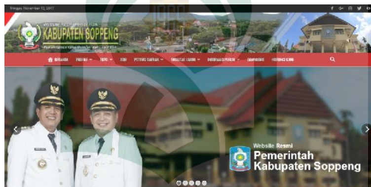
UNIVERSITAS ISLAM NEGERI Gambar 4.2 Situs Resmi Kabupaten Soppeng

terdiri sembilan menu yaitu, Beranda, Profil, SKPD, JDIH, Potensi Daerah, Fasilitas Umum, Informasi Publik, Download dan Hubungi Kami. Dimana setiap menu memiliki fungsi masing-masing dan situs ini di kelolah oleh keminfo kab.Soppeng dimana setiap kegiatan pemerintah Kabupaten Soppeng di publikasikan pada situs ini agar masyarakat Kabupaten Soppeng dapat mengetahui semua kegiatan pemerintahan selain itu situs ini juga merupakan media dalam sosialisasi kebijakan pemerintah demi pemerataan penyampaian informasi. Salah satu bentuk publikasi kegiatan pemerintah yang di infokan dalam situs ini adalah sosialisasi cagar budaya yang dilakukan di hotel Grand Saota.