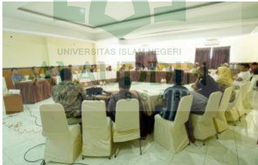
Suasana peserta seminar yang bertajuk “Kajian Pelindungan Cagar Budaya Kawasan Lembah Walanae, Kabupaten Soppeng, pada hari senin, 14 Agustus 2017, di hotel Grand Saota, kabupaten Soppeng