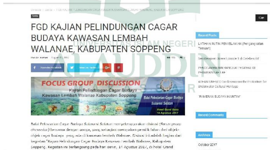
Salah satu pemberitaan di Situs resmi Kabupaten Soppeng tentang cagar budaya