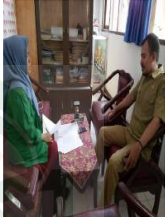
Wawancara dengan Guru Kesiswaan