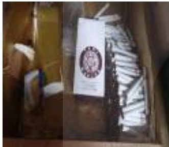
Kemasan Tani Madjoe

Dari kedua uraian diatas dapat dijumpai 2 bentuk sanksi antara lain :