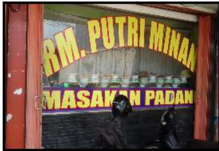
Foto Tampak Depan (Etalase) Makanan Rumah Makan Padang Putri Minang