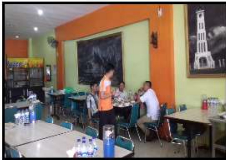
Proses Karyawan Nmelayani Pembeli