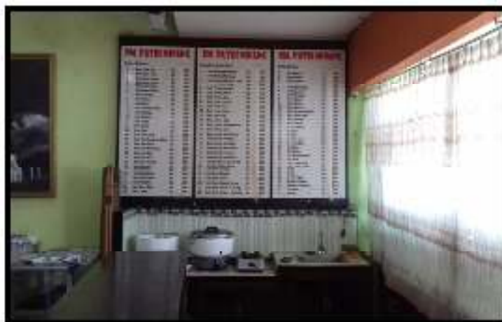
Foto Daftar Menu