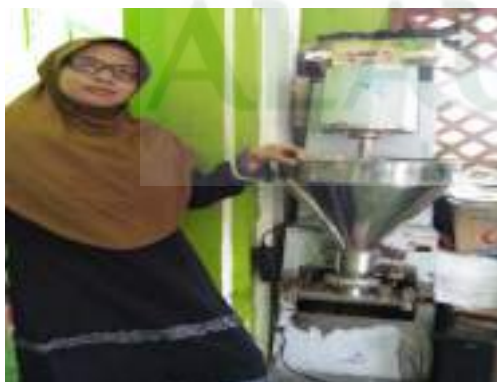
Owner Bakso Qolbu dan Pencetak Bakso