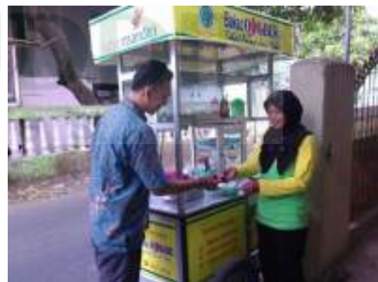
Konsumen yang membeli Bakso Qolbu dengan program Pemberdayaan Landa