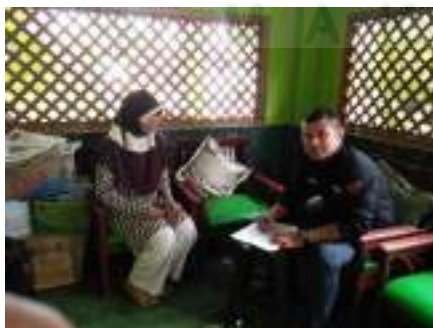
Foto Wawancara bersama Produksi Bakso Qolbu