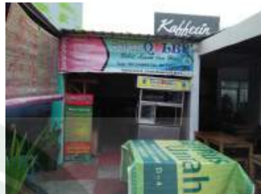
Lokasi Bakso Qolbu di Pasar Segar