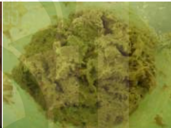
Daging yang sudah digiling menjadi adonan Bakso Qolbu