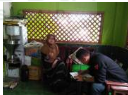
Foto Wawancara bersama Owner Bakso Qolbu