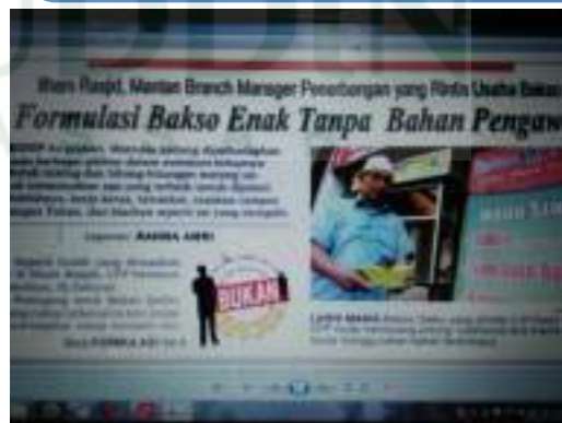
Pelatihan Kewirausahaan bekerjasama Yayasan Kalla