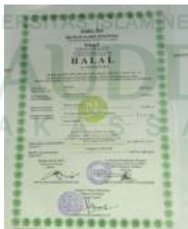
Gambar 3. Sertifikat Majelis Ulama Indonesia 7

Hj Zakiyah menjelaskan bahwa dengan adanya sertifikasi dan nomor LP POM MUI Sulawesi Selatan, masyarakat bisa memilih dan memilah makan yang halal dari pembuatan yang sesuai syariat Islam, selain legalitas kehalalan, Bakso Qolbu menjadi pusat dakwah di bidang makanan yang menginformasikan sebagai makanan yang SAH (Sehat, Aman dan Halal). Berdasarkan LP POM dengan No 06010003910810 bahwa setiap kemasan produk Bakso Qolbu produsen dianjurkan mencetak label halal dan nomor sertifikat.