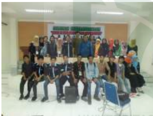
Seminar Kewirausahaan dengan Mahasiswa Manajemen Dakwah