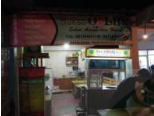
Bagian Depan Lokasi Bakso Qolbu di Pasar Segar Kota Makassar