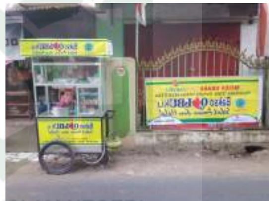
Gerobak Bakso Qolbu yang ada di Jl Sunu