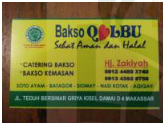
Kartu Nama Bakso Qolbu