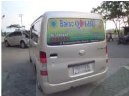
Stiker Mobil Bakso Qolbu