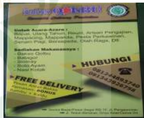
Brosur Bakso Qolbu dalam pelayanan Delivery maupun Catering