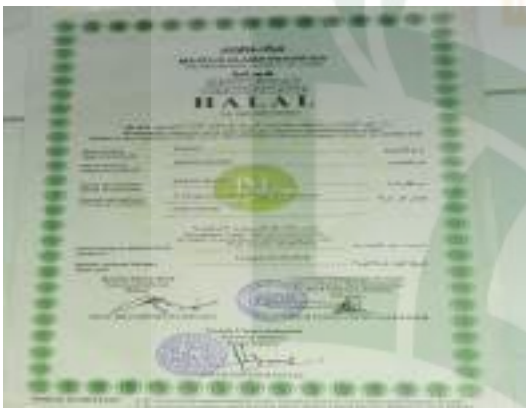
Sertifikat Halal dari Majelis Ulama Indonesia Sulawesi Selatan.