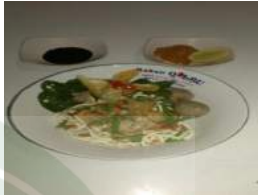
Contoh Porsi Bakso Qolbu