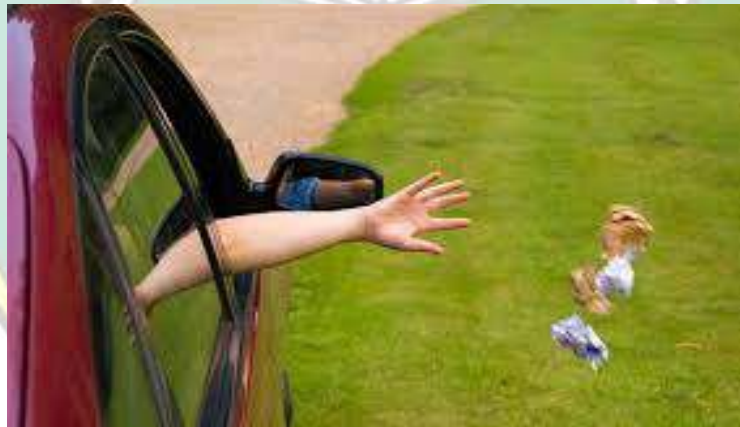
tentang dampak membuang sampah diatas mobil.

Dalam pemaparannya disetiap kegiatan sosialisasi, pihak kepolisian juga bisa memperlihatkan contoh gambar