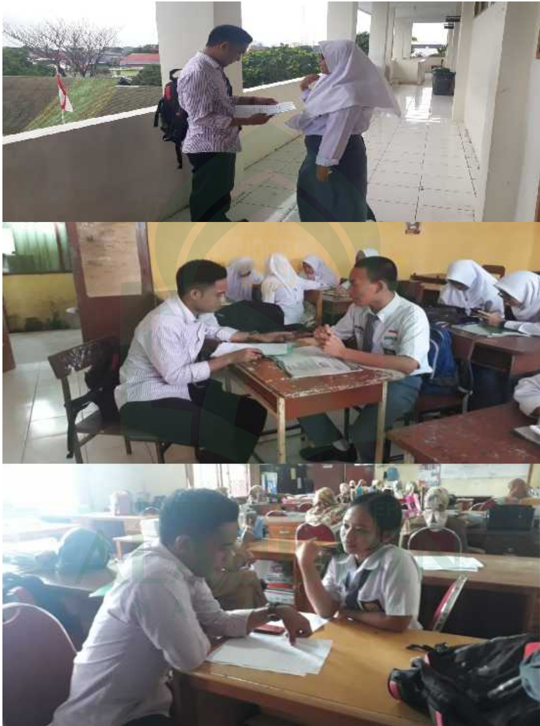
Gambar 12. Wawancara Siswa PAI Kelas X,XI dan XII SMA Negeri 8 Makassar