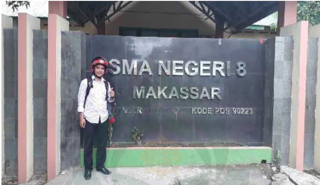
Gambar 1. Pintu Gerbang SMA Negeri 8 Makassar