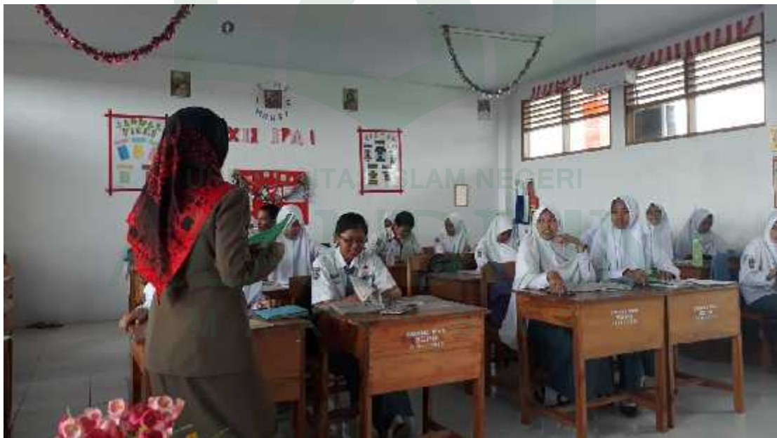
Gambar 7. Proses Pembelajaran PAI Kelas XII SMA Negeri 8 Makassar