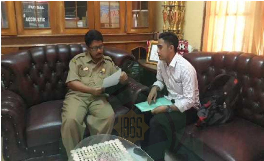
Gambar 5. Wawancara Kepala Sekolah SMA Negeri 8 Makassar