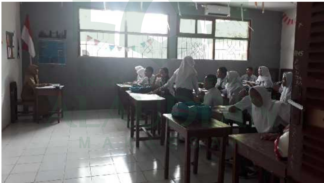
Gambar 11. Proses Pembelajaran PAI Kelas X SMA Negeri 8 Makassar