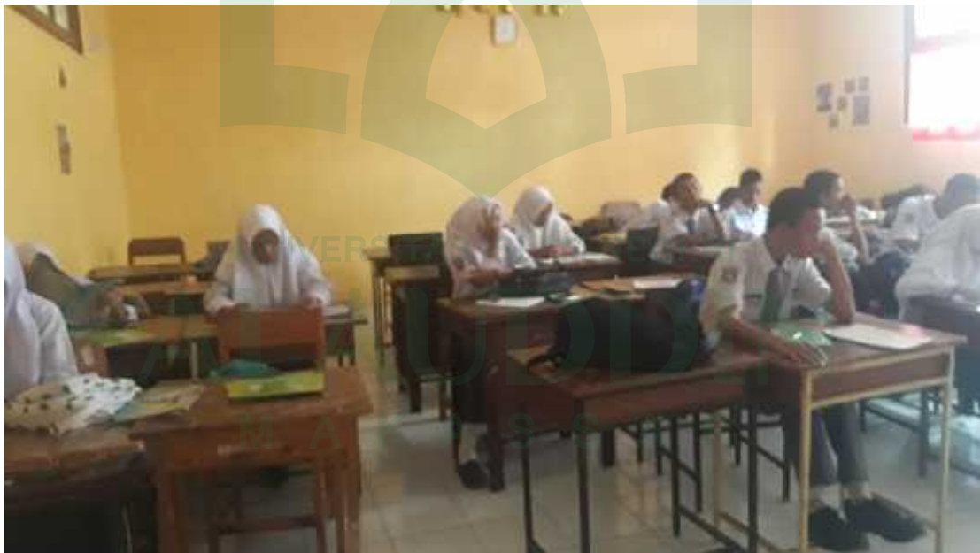
Gambar 9. Proses Pembelajaran PAI Kelas XI SMA Negeri 8 Makassar