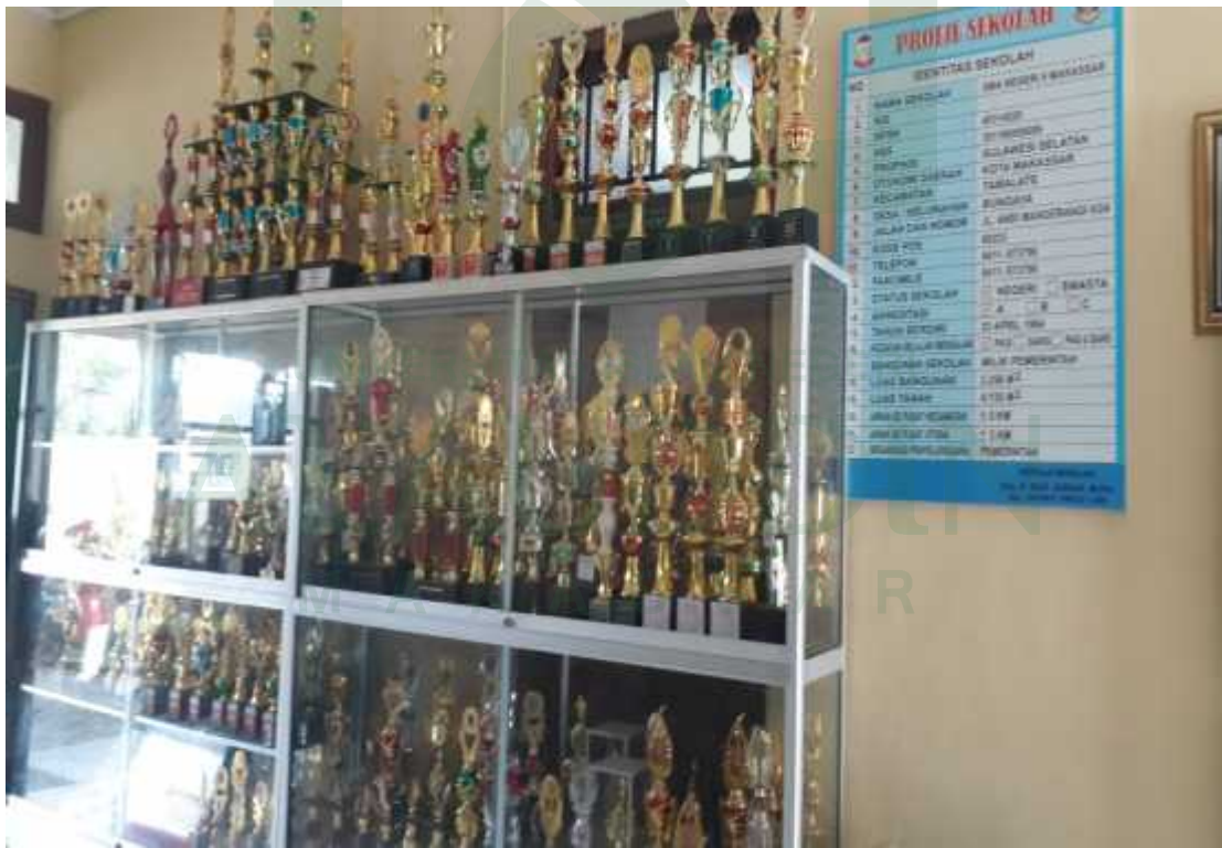
Gambar 13. Piala Prestasi SMA Negeri 8 Makassar