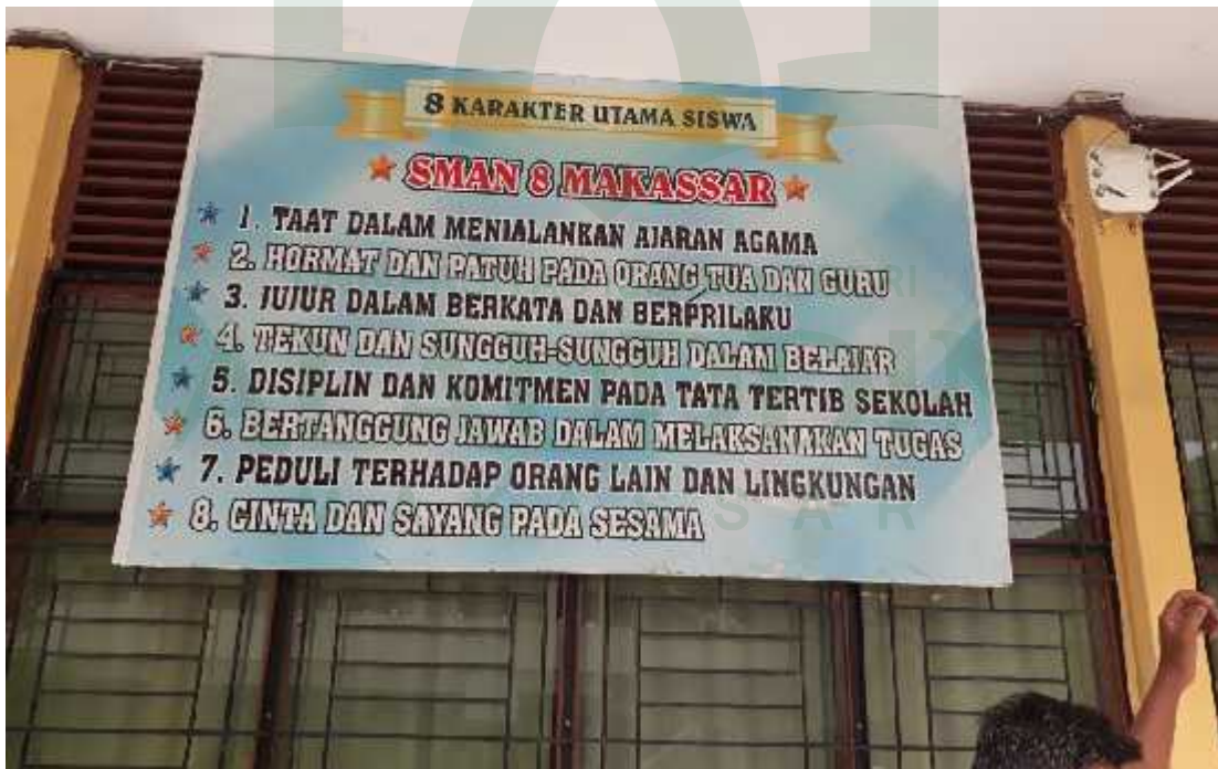
Gambar 4. 8 Karakter Utama SMA Negeri 8 Makassar