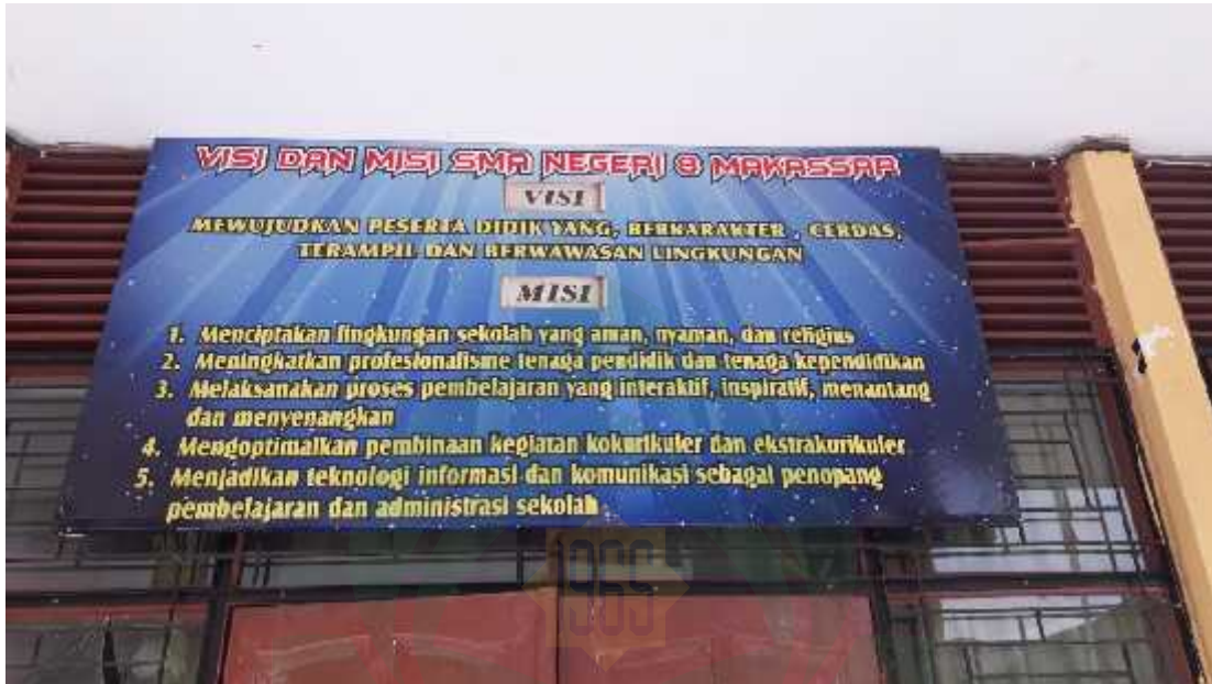
Gambar 3. Visi dan Misi SMA Negeri 8 Makassar