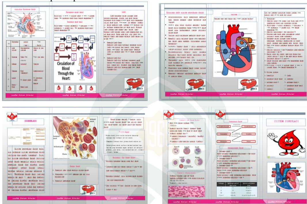
Gambar 4. 1: prototipe I