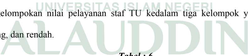
Tabel : 6 Kategori Total Quality Management di SMA Negeri 11 Makassar

Setelah diketahui hasil Mean (56) dan Standar Deviasi (6), kemudian mengelompokan nilai pelayanan staf TU kedalam tiga kelompok yaitu tinggi, sedang, dan rendah.