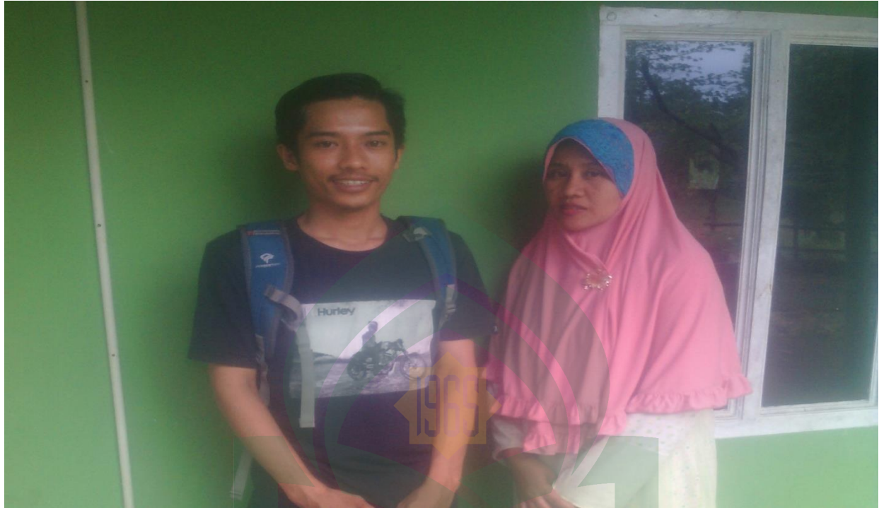
6. Peneliti bersama penggadai ( rahin ) bapak sakka