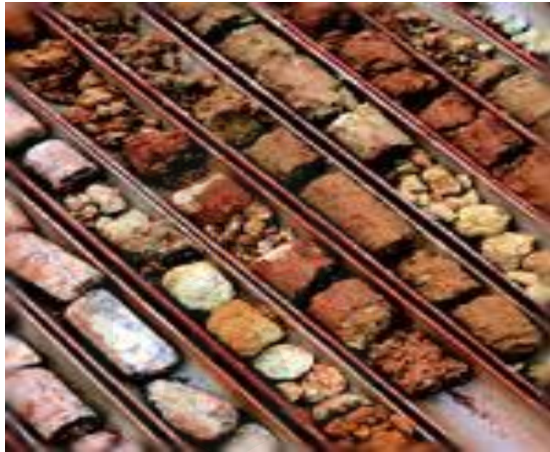
Gambar 4.1 Biji Nikel

Komoditas utama ANTAM adalah bijih nikel kadar tinggi atau saprolit, bijih nikel kadar rendah atau limonit, feronikel, emas, perak dan bauksit. Jasa utama ANTAM adalah pengolahan dan pemurnian logam mulia serta jasa geologi.