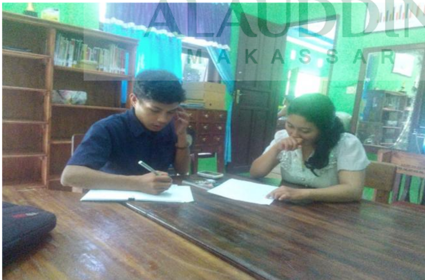
Proses Wawancara dengan Pengelola Taman Baca