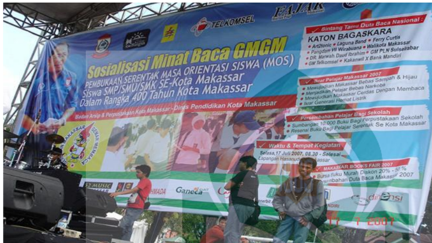
Sosialisasi Minat Baca Gerakan Makassar Gemar Membaca (GMGM).