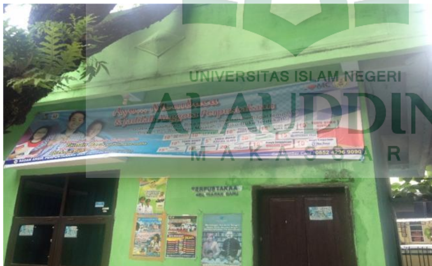
Gedung Taman Baca Kelurahan Baru Kota Makassar.