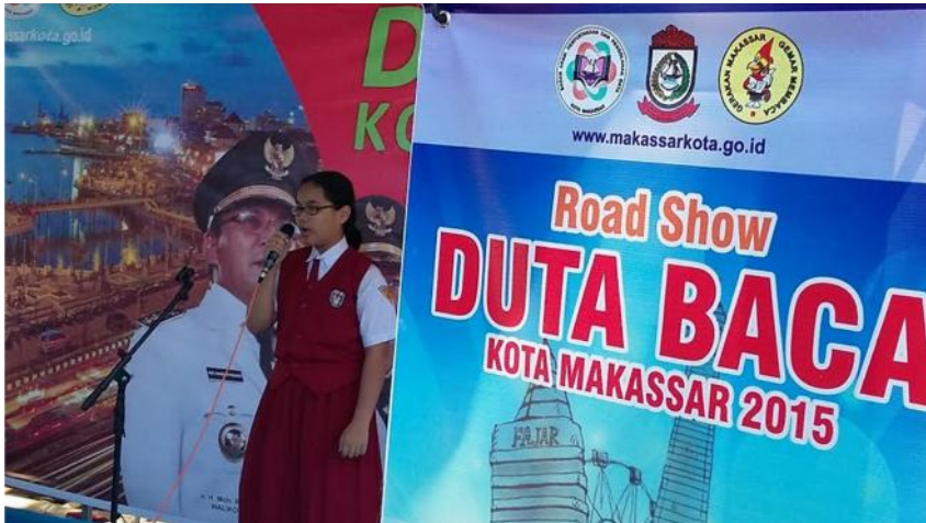
Roadshow duta baca BAPPD kota Makassar yang diselenggarakan di Taman Macan Jalan Balai Kota, Rabu (26/8/2015).