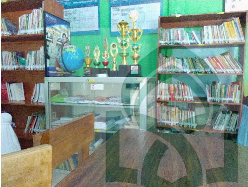
Koleksi Taman Baca Kelurahan Baru Kota Makassar