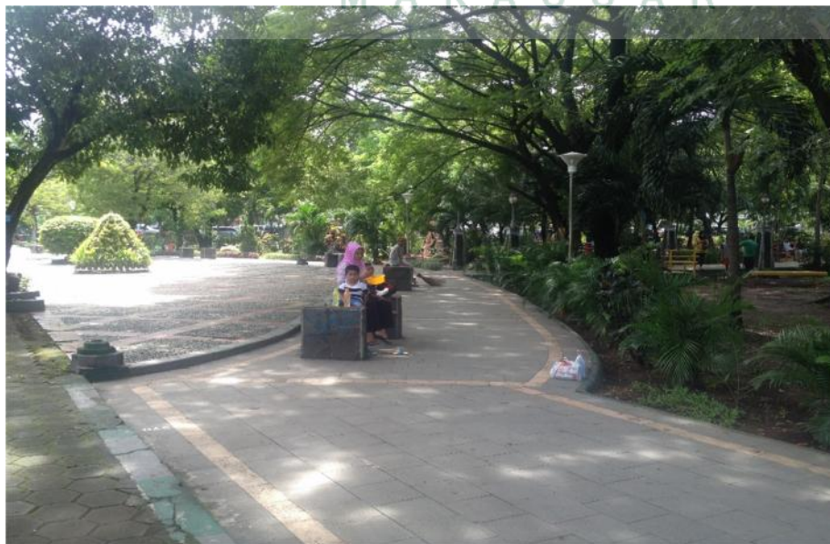
Taman Baca Kelurahan Baru Kota Makassar (Taman Macan).