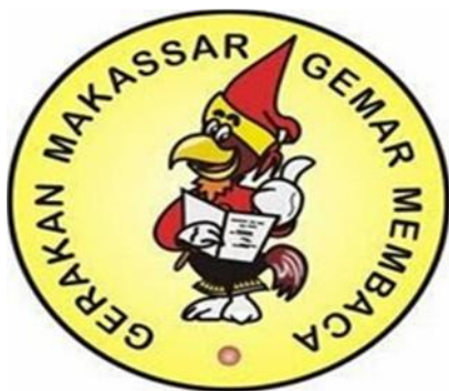
Logo Gerakan Makassar Gemar Membaca (GMGM).