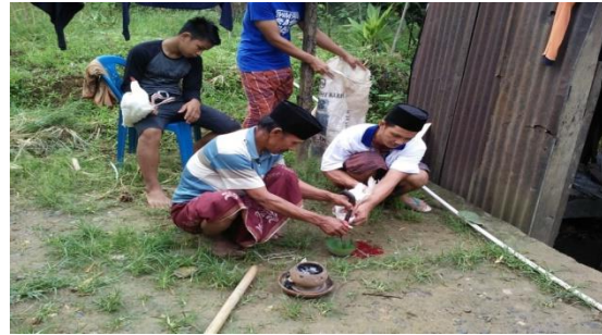
Saat pemotongan ayam