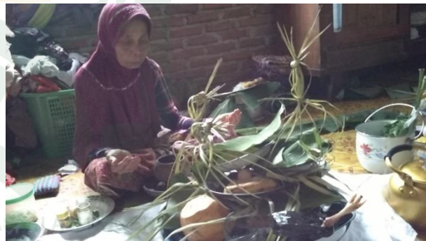
Sebelum proses Mappannonno' Salo di lakukan.