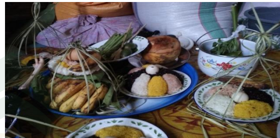
Sesaji yang disimpan di rumah