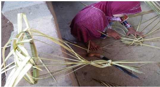
Daun Enau yang bentuk seperti tempat wadah sebagai penghias piring