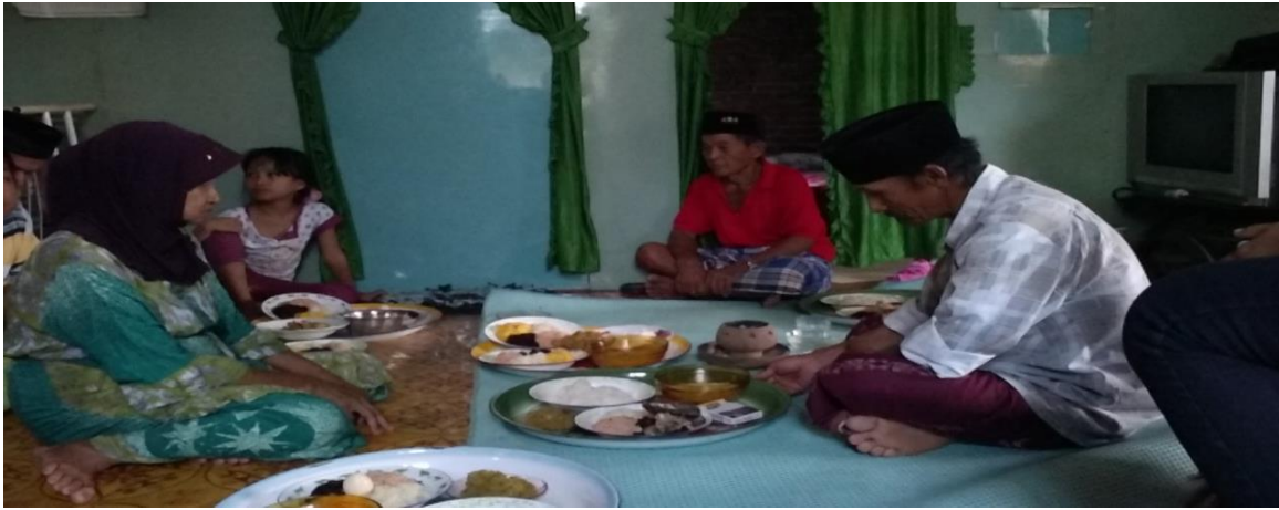
Proses Ma' baca sebelum makan bersama