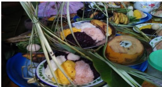
Sesaji yang akan di turunkan ke sungai