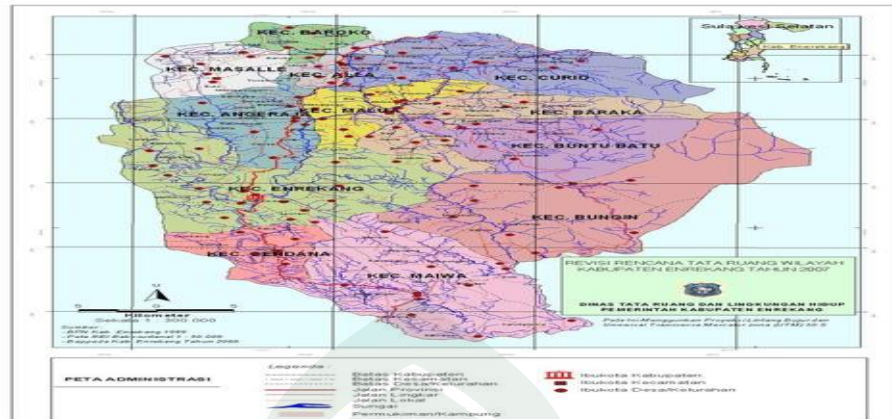
Peta kabupaten Enrekang

flora yang banyak ditemukan pohon bitti atau yang biasa disebut pohon hitam Sulawesi, selain itu terdapat juga rotan lambang.