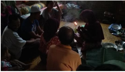
proses sebelum semua ayam di potong.